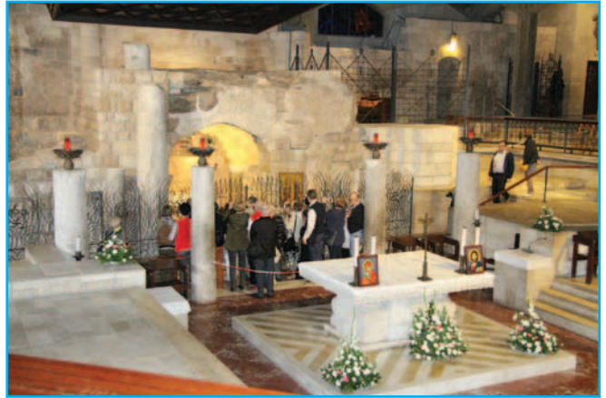
Bazylika Zwiastowania Pańskiego w Nazarecie