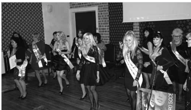
Wszystkie Miss, pełne wdzięku, zachęcały do udziału w projekcie