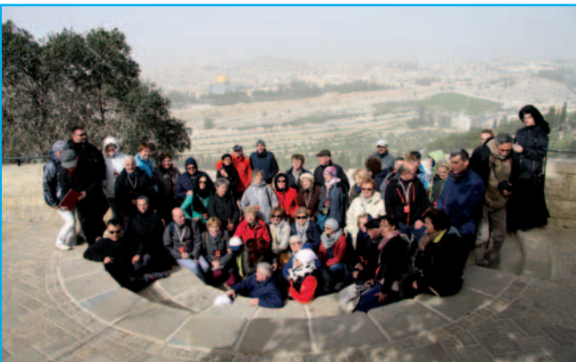
Wszyscy uczestnicy pielgrzymki na tle Jerozolimy (Jeruzalem) z Doliną Cedronu