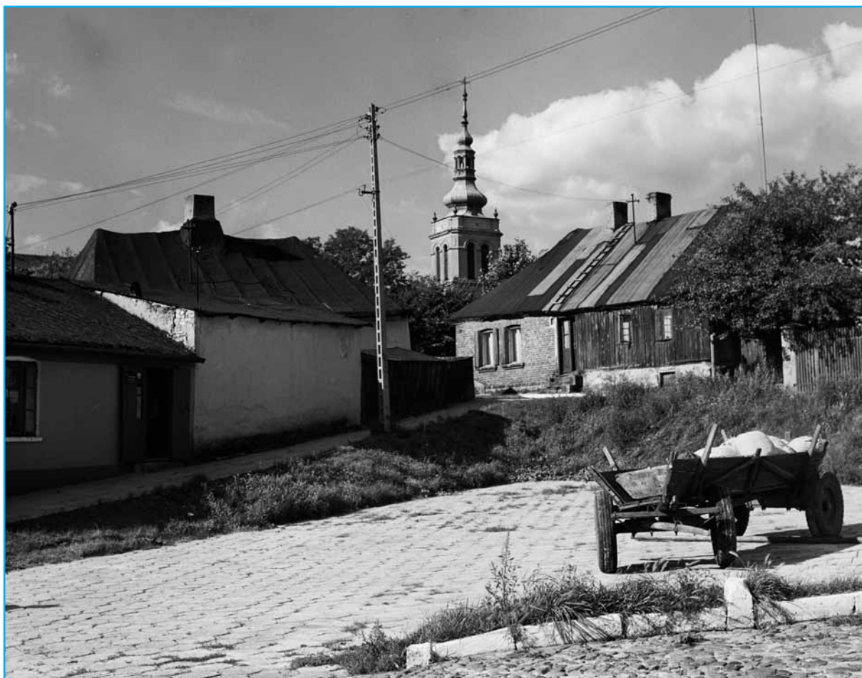
Uniejów, rok 1972 - parking przy ul. Tureckiej