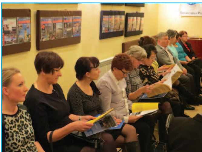
Do rąk uczestników spotkania trafił pierwszy numer specjalny z 1993 roku