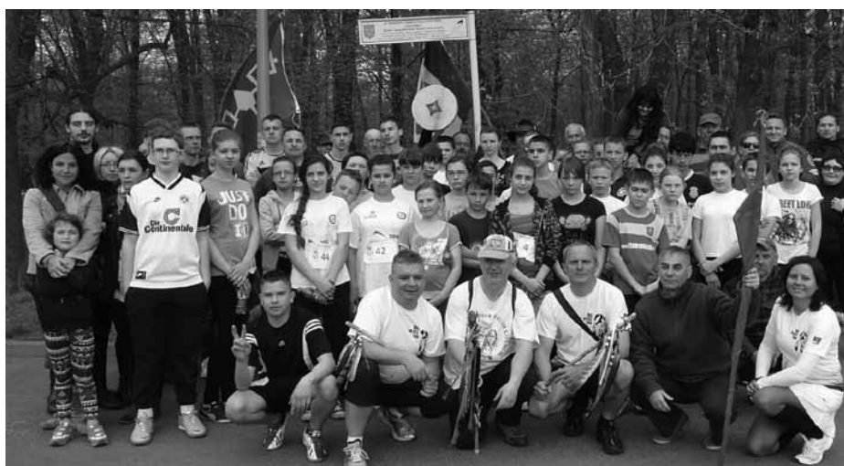
Uczestnicy ubiegłorocznego Biegu na Rzecz Ziemi (ze zb. Mateusza Długosza)

Tak jak w poprzednim roku na ulicach Uniejowa będzie miało miejsce niezwykle wydarzenie. Mówię tu o „Biegu Na Rzecz Ziemi” – cyklicznie organizowanym Biegu mającym na celu zwrócenie uwagi ludzi w stronę dobra naszej Planety. Pod tą szczytną ideą w ubiegłorocznej edycji Biegu podpisało się ponad 100 biegaczy, a prawie 20 osób wyruszyło marszem w stronę Miasta Wody. Byli to ludzie, którym los Ziemi nie jest obojętny. Jeśli więc i Ty chcesz pokazać, że nie przechodzisz obojętnie wobec rosnącego problemu naszej Planety, dołącz do tegorocznego „Biegu Na Rzecz Ziemi”. Start nastąpi 11 kwietnia 2015r. o godzinie 10.00 z parkingu przy rondzie w Starym Gostkowie (17 km od Uniejowa), a Bieg zakończy się około godziny 13.30 w Alei Sat-Okha w Uniejowie. Tempo będzie dostosowane do osób najwolniejszych - pamiętajmy, to nie jest wyścig! Zabierz strój sportowy, wygodne buty i pokonaj własne słabości w słusznym celu. Zapraszamy 11 kwietnia 2015r. na trasę do uczestnictwa w V Biegu Na Rzecz Ziemi. A po zakończonym Biegu rozpocznie się wiosenne święto polskich indianistów - Pow Wow, podczas którego można poznać pieśni, tańce, kulturę materialną wielu plemion indiańskich. Jak głoszą organizatorzy Pow wow - będzie można porozmawiać z Indianami z Arizony, którzy są gośćmi specjalnymi tegorocznego Pow wow w Uniejowie.