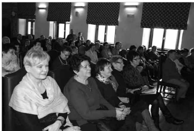
Gieszyła frekwencja uniejowianek, którym dedykowane było spotkanie

bądź gotowa na pięćdziesiąte urodziny na dostatek mądrości i piękna wiek to nie jest wprawdzie niewinny ale bliżej już jesteś słońca