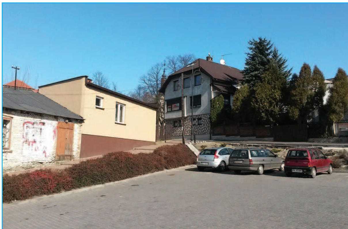
Uniejów, marzec 2015 - parking przy ul. Tureckiej