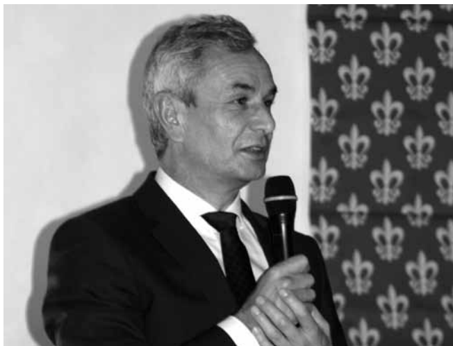
Minister Sportu Andrzej Biernat

Po wysłuchaniu prelegentów głos zabrał minister Andrzej Biernat. „Nie od dzisiaj jestem pod wrażeniem Uniejowa” - powiedział. Podkreślił, że uniejowskie inwestycje to sztandarowe w kraju działania ze środków unijnych. Minister A. Biernat wspominał czasy, gdy rodziły się pierwsze projekty, doceniając także kolejne, powstające w Uniejowie działania i inwestycje. Zdaniem ministra, w