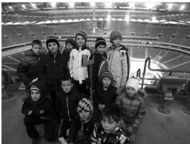
Turniej w Warszawie był okazją do zwiedzenia Stadionu Narodowego.

01.03.2015 – Turniej Halowej Piłki Nożnej „O Termalny Puchar Burmistrza Uniejowa” (Rocznik 2006)