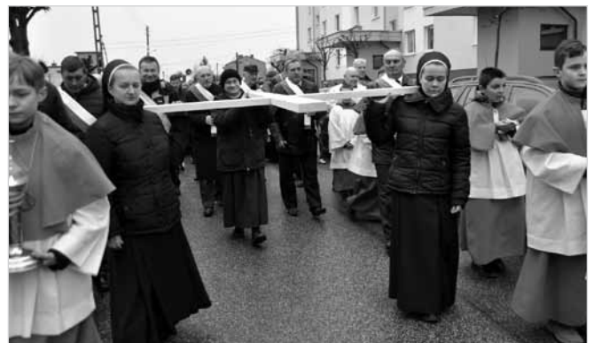
Trasa Drogi Krzyżowej wiodła m.in. ul. Szkolną. Krzyż nieśli też członkowie Cechów Rzemieślniczych Uniejowa i siostry zakonne ze Zgromadzenia Sióstr Wspólnej Pracy od NM w Uniejowie