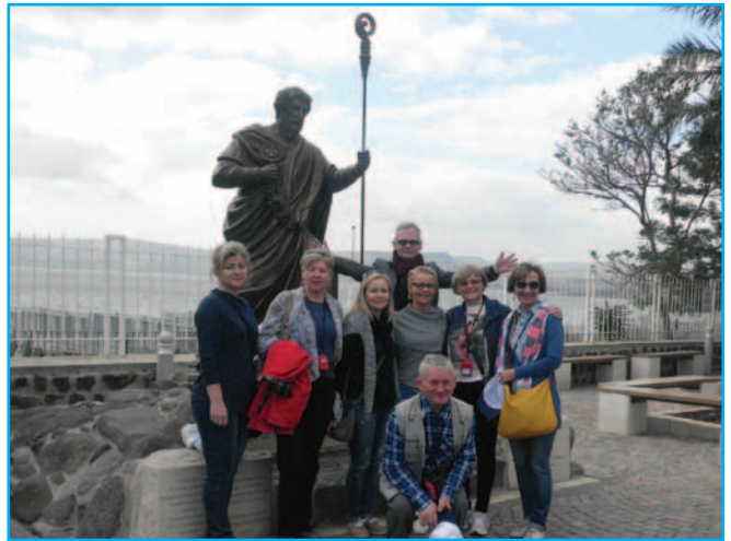
W Kafarum (Mieście Jezusa nad Jeziorem Galilejskim) u stóp posągu św. Piotra