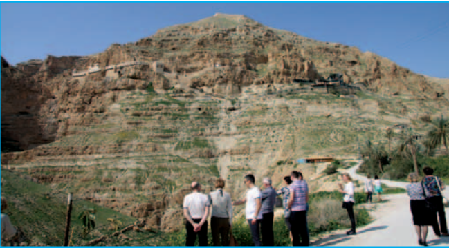
U podnóża Góry Kuszenia w Jerycho-najstarszym mieście świata (8000 lat p.n.e)