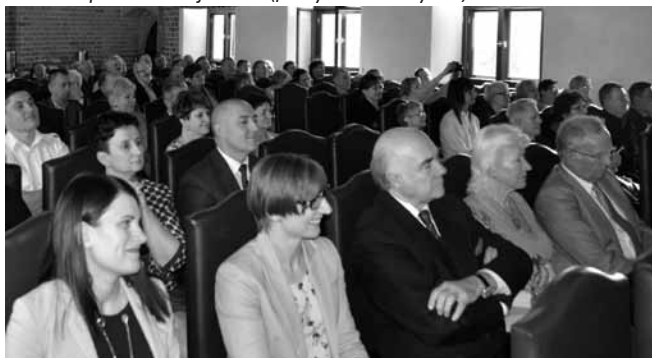
Na pierwszym planie kierownictwo Instytutu Zdrowia Człowieka i pracownicy Uzdrowiska Uniejów -Park

Uniejowie na uwagę zasługuje fakt, że oprócz inwestycji publicznych powstają prywatne, co jest impulsem do dalszych inicjatyw. Andrzej Biernat będzie, jak zawsze, kibicował Uniejowowi i wspierał na miarę swoich kompetencji i możliwości. Wyraził przekonanie, że ufając pomysłem burmistrza i jego determinacji w działaniu, można wierzyć, że Uniejów zrealizuje swoje ambitne, unikatowe projekty.