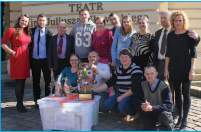
POZYTYWKA przed budynkiem teatru im. Juliusza Słowackiego