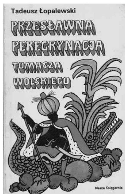
Przednia okładka III wyd. książki T. Łopalewskiego, Przesławna peregrynacja Tomasza Wolskiego z 1978 r.