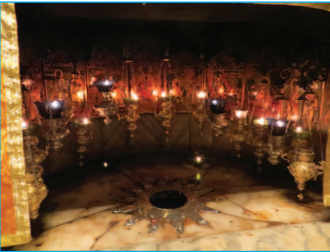
W Bazylice Narodzenia Pańskiego w Betlejem-grota z gwiazdą oznaczającą dokładne miejsce narodzin Pana Jezusa