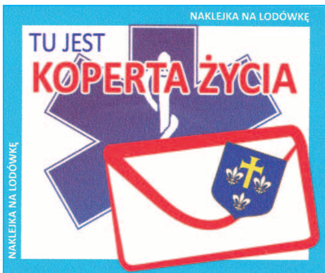
Naklejka na lodówkę