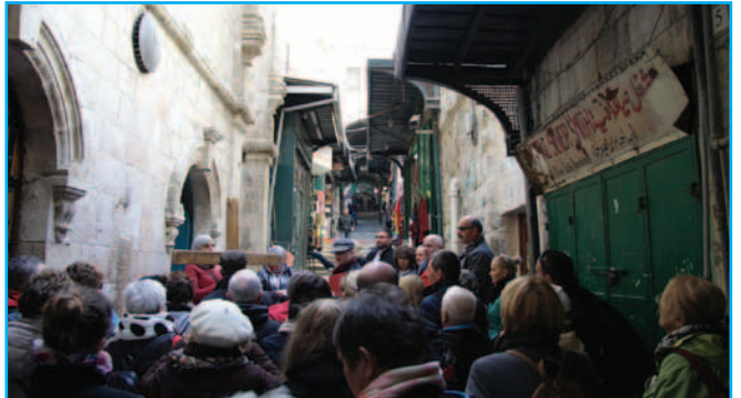
Uniejowanie podczas Drogi Krzyżowej na Via Dolorosa w Jerozolimie