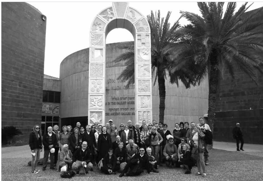
Jedna z wielu wspólnych fotografii na pielgrzymkowej trasie