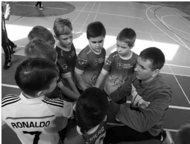
Piłkarze to silne poczucie przynależności gwarantujące bezpieczeństwo i prawidłowy rozwój dziecka.

28.02.2015 – Turniej ARPiT Cup w Koluszkach