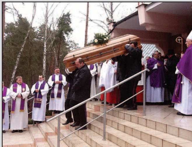
Włocławek, 3 marca 2015. Po Mszy św. w kościele parafialnym przy Domu Księża Emerytów trumnę z ciałem przewieziono do rodzinnej miejscowości Zmarłego - do Węgierskiej Górki