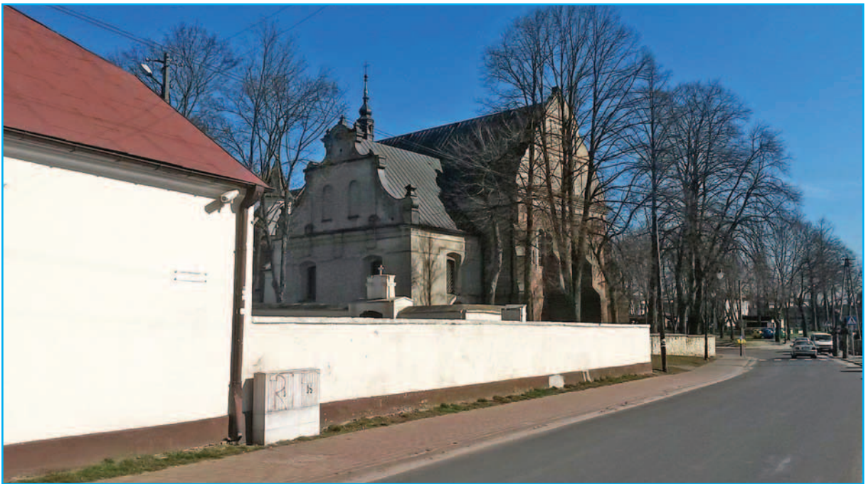
Uniejów, marzec 2015. Fragment plebani i puste miejsce po Katolickim Domu Ludowym przy ul. Kościelniczej