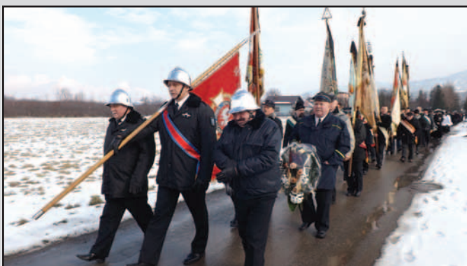
W drodze na nowy cmentarz komunalny. Na czele długiego konduktu żałobnego uniejowskie delegacje ze sztandarami