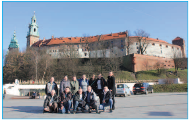
Uczestnicy wraz z opiekunami przy okazji występu na Albertianie zwiedzili Kraków. Na zdj. Wawel