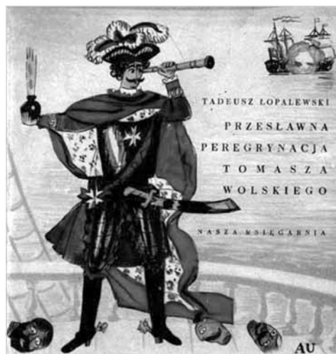
Przednia okładka I wyd. książki T. Łopalewskiego, Przesławna peregrynacja Tomasza Wolskiego z 1959