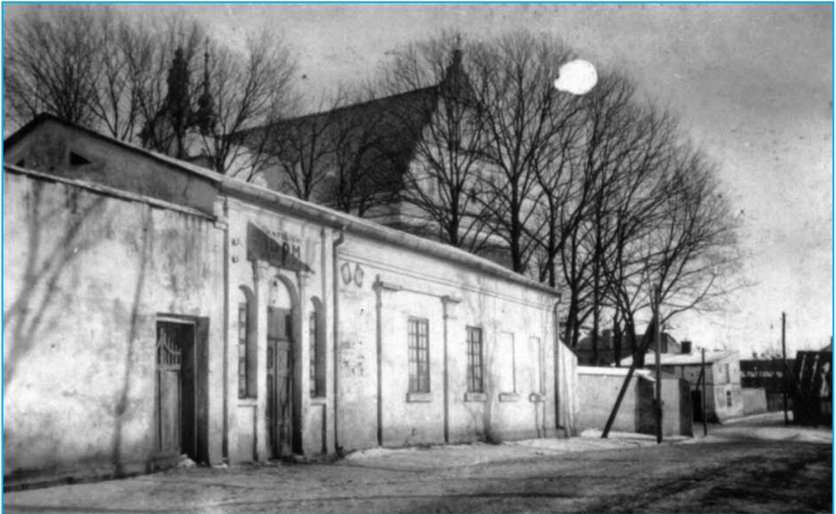
Uniejów, około 1934 roku. Katolicki Dom Ludowy przy ulicy Kościelniczej przylegający do parkanu przy kościele