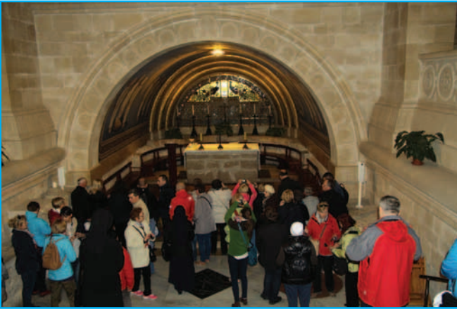
Bazylika Przemienienia Pańskiego na Górze Karmel