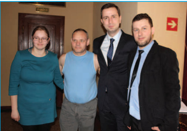
Możliwość rozmowy z Ministrem Pracy i Polityki Społecznej była nie lada gratką dla uczestników i opiekunów