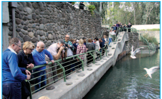
Yardenit-dokładne miejsce chrztu Pana Jezusa w rzece Jordan