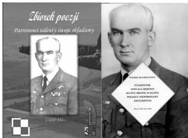
Okolicznościowy tomik poezji a w nim diamentowy wiersz ( arch. Towarzystwa Przyjaciół Uniejowa)