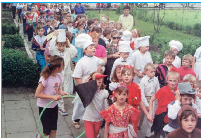
Chłopcy jednej z młodszych klas pokazali się jako kucharze (ze zb. Urszuli Urbaniak)