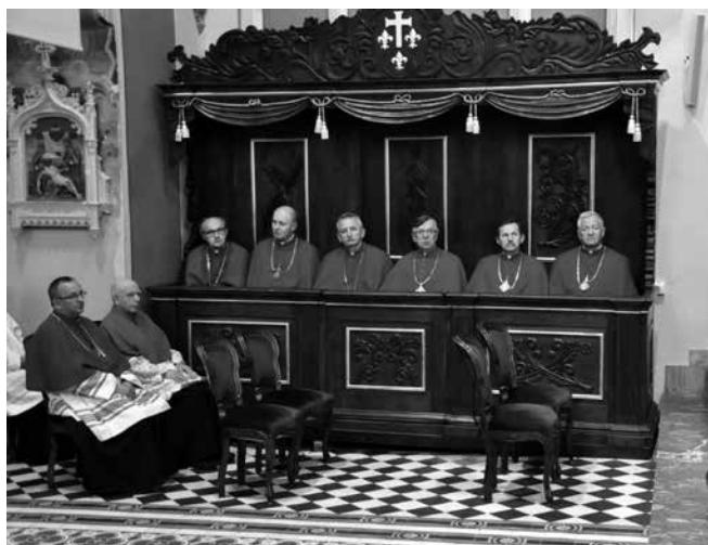
W trzech odnowionych stallach kanonickich zasiedli członkowie Uniejowskiej Kapituły