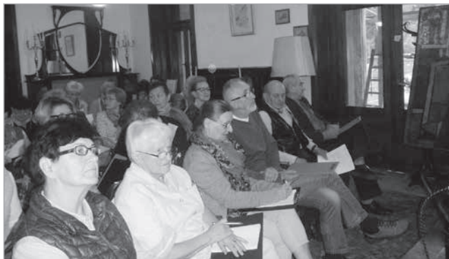
Na wykładzie w jednej z sal Muzeum Miasta Łodzi

Zwiedziliśmy Muzeum, po którym oprowadził jego kustosz. Pozostała jeszcze wycieczka do Zgierza i Łowicza, którą odbędziemy 17 września na koszt projektu.