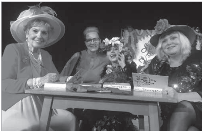
Niektórym udało się zdobyć autografy i stanąć do wspólnej fotki.

Z wielkim smutkiem przyjęliśmy wiadomość o śmierci naszej koleżanki