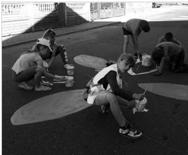
Malowanie trasy Bożego Ciąła