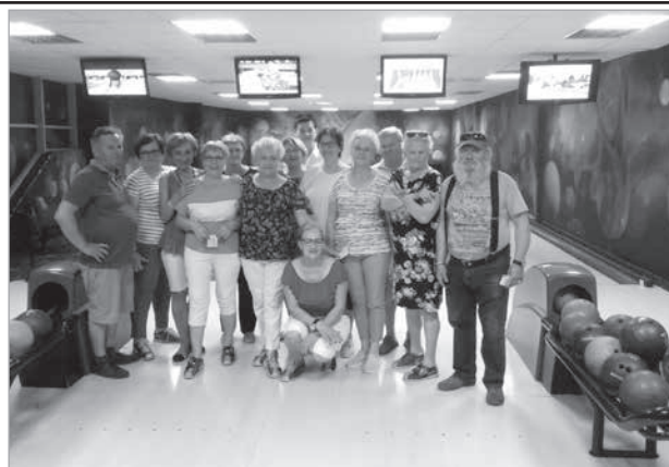
Uczestnicy zawodów na kręgielni

Zawodom towarzyszyły wielkie emocje i wzajemne wspieranie się. Było wiele okrzyków radości po strąceniu 10 kręgli w jednym rzucie, ale i gesty zawodu, kiedy kula powędrowała w rynnę. Po wakacjach wracamy na kręgielnię!