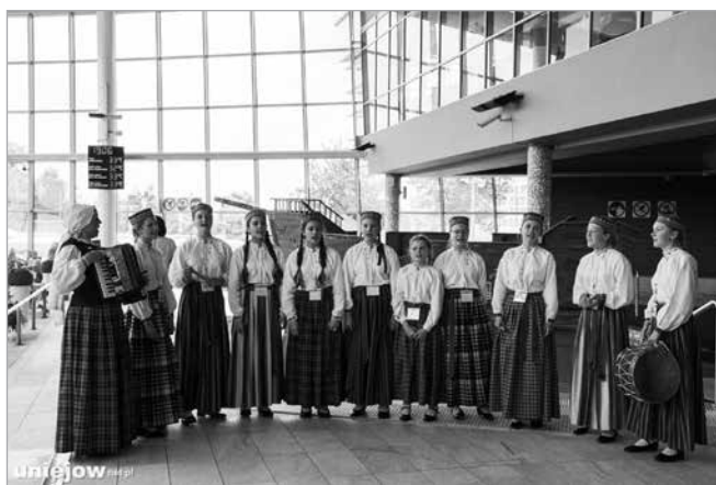
Zespół „Młodzi Łatgalczycy” z Łotwy podczas występu na Termach