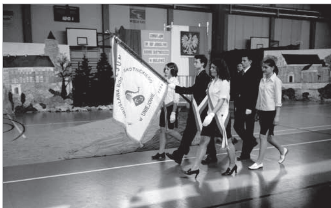
26 kwietnia 2004 roku. Szkolne poczty sztandarowe prezentują przekazany przez Radę Rodziców sztandar