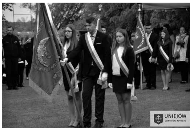
Na pierwszym planie sztandar Szkoły Podstawowej w Wieleninie