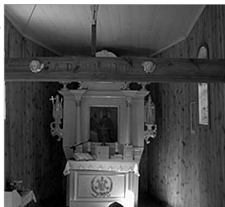
Ołtarz we wnętrzu pustelni

W okresie od maja do września Kaplica na Puszczu dostępna jest w każdą sobotę przed południem, ponieważ o godz. 9.00 odprawiane jest tam nabożeństwo.