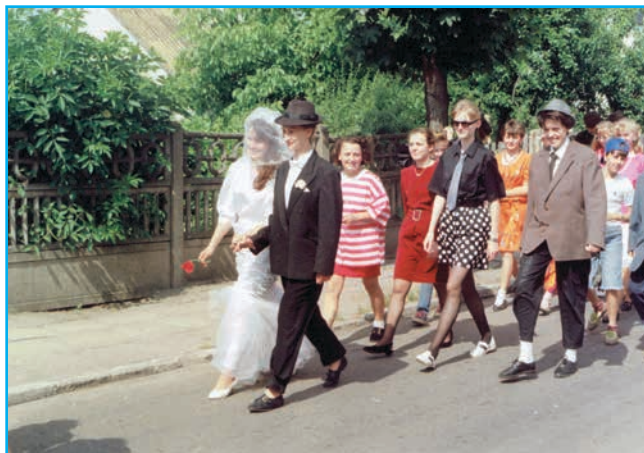
Za młodą parą goście weselni (ze zb. Urszuli Urbaniak)