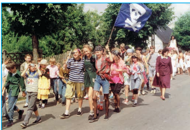
Na chwilę na ląd zeszli piraci