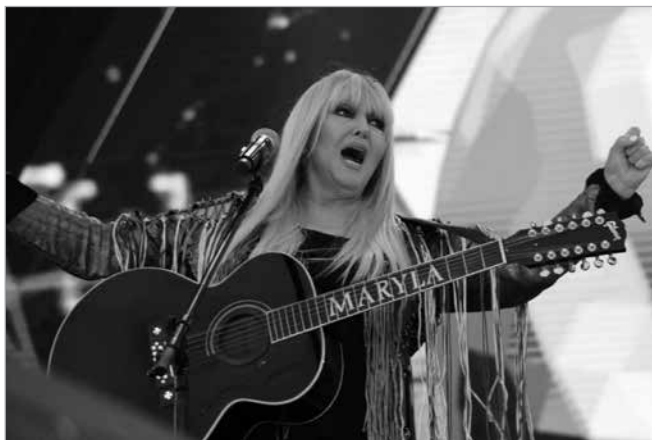
Maryla Rodowicz nie zawiodła swoich fanów

W tym samym dniu odbyły się również Pierwsze Otwarte Mistrzostwa Polski w Noszeniu Żon. Uniejów otrzymał prawa do organizacji zawodów na podstawie