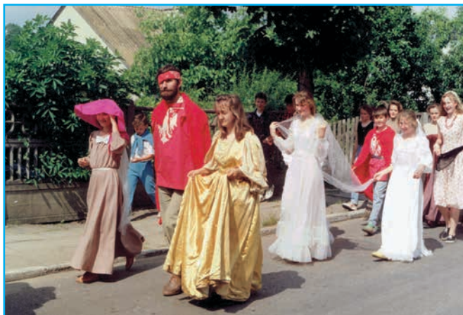
Gratulacje dla klasy, której udało się ucharakteryzować wychowawcę na „Juranda ze Spychowa”