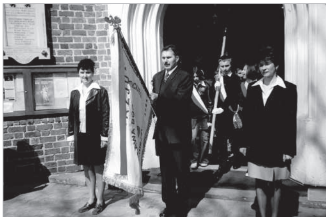
26 kwietnia 2004 roku. Po Mszy św. w kolegiacie poświęcony sztandar wędruje do szkoły w asyście członków Rady Rodziców