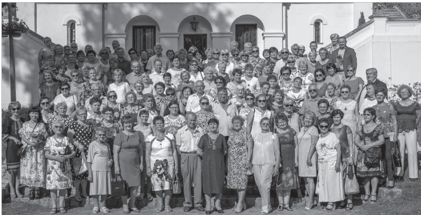
Większość słuchaczy stanęła do pamiątkowego zdjęcia na schodach paradnych zamku