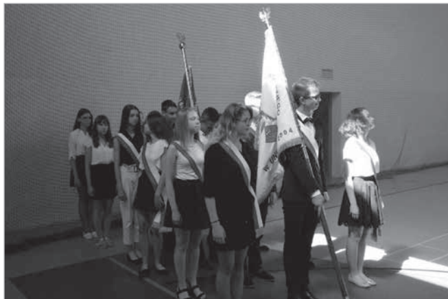
19 czerwca 2019 roku. Po raz ostatni sztandar gimnazjum został wprowadzony na uroczystość zakończenia roku szkolnego