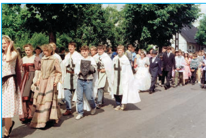
Czarne krzyże na białych płaszczach podpowiadają, kto maszeruje