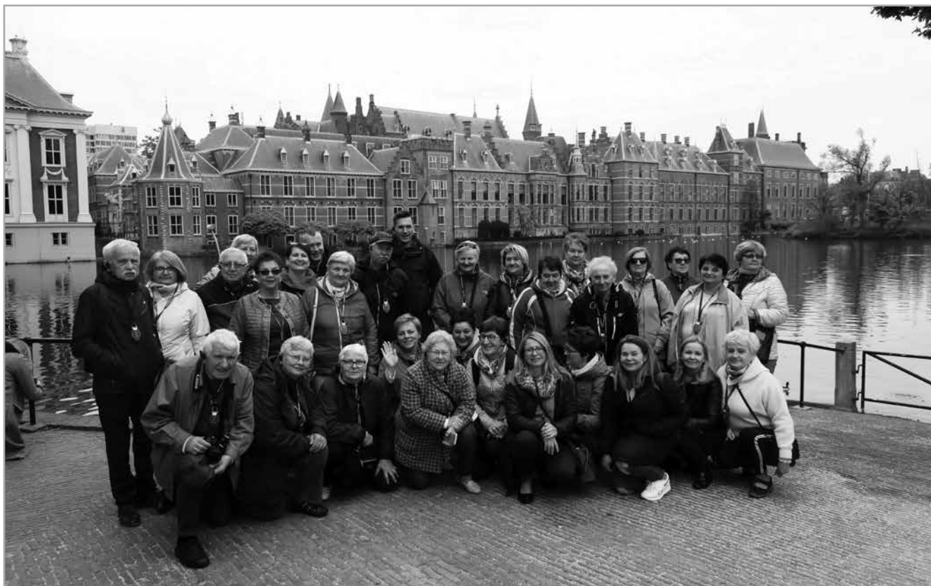
W Hadze, podczas zwiedzania uniejowscy turyści sfotografowali się na tle budynku holenderskiego Parlamentu.