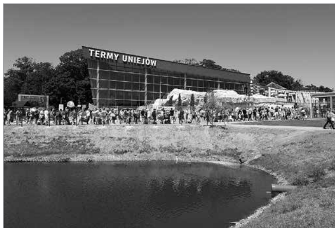
Uniejowskiej termy oblegane przez turystów

Andrzej Zwoliński tel. 607-772-257, e-mail: andrzej.zwolinski@wp.pl