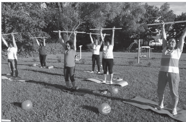
Aerobic na terenie przyszkolnym w Wieleninie

Piękna i słoneczna pogoda zachęcała do aktywności nie tylko na sali, czy na basenie. Dzięki ćwiczeniom „pod chmurką” podnieśliśmy swoją kondycję, zyskaliśmy dobry humor i duży zastrzyk energii. Wiemy, że wakacje nie mogą być dla nas przerwą od ćwiczeń.