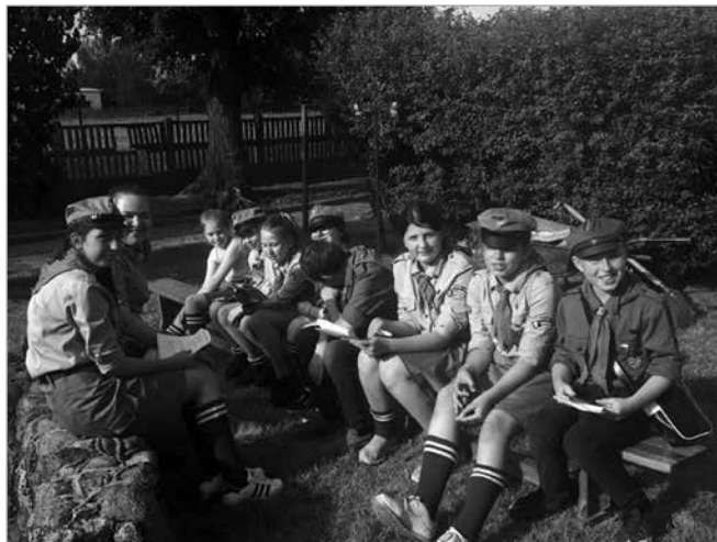
Jedna z drużyn przed wyruszeniem na trasę biegu

Ostatnim punktem imprezy było oglądanie zabytkowych samochodów, chętni mogli również wziąć udział w przejażdżce.