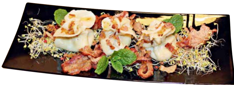
Jedna z festiwalowych potraw – propozycja Restauracji „Zorbas”

którzy już wiedzą, że data im odpowiada, przesyłają swoje kulinarne propozycje.