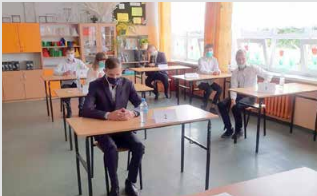
Uczniowie klasy VIII tuż przed egzaminem