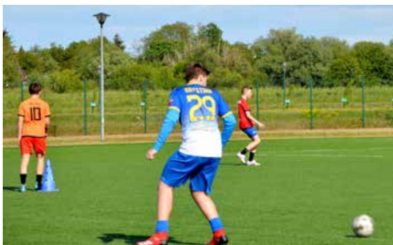
Akademia Ebiego Smolarka wróciła do gry