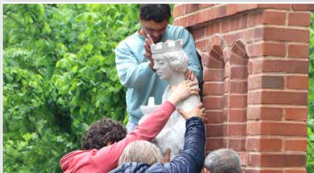
Budowa ogródka rekreacyjnego przy Szkole Podstawowej w Uniejowie