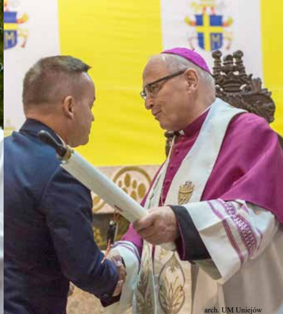
Jego Eksceleńcja Ksiądz Biskup na Uroczystości Bożego Ciała w Spycimierzu