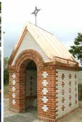
Prace montażowe przy Kaplicy Świętego Antoniego Kaplica Świętego Antoniego