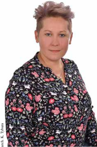
arch. K. Tybura

Nowej Pani Sołtys życzymy wytrwałości w realizacji postawionych przez siebie celów, gotowości do stawiania czoła nowym wyzwaniom i dobrej współpracy z mieszkańcami. Niech sprawowana funkcja przynosi jedynie satysfakcję i zadowolenie.