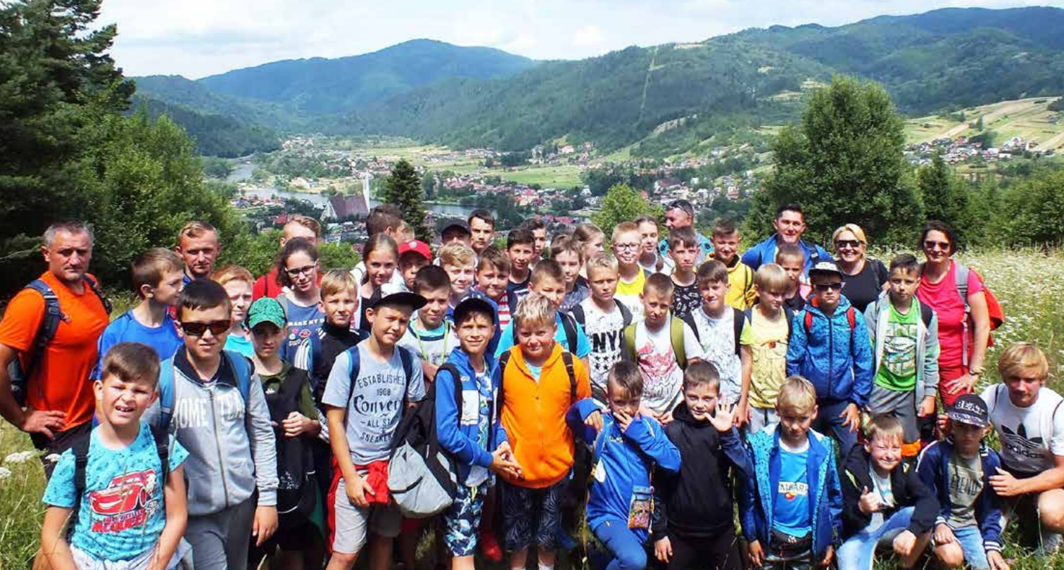
Uczestnicy obozu w Krościenku