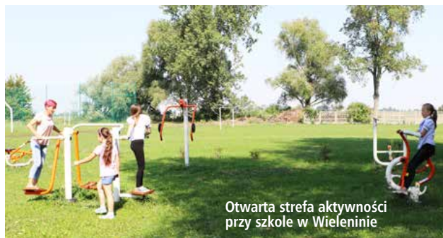
Otwarta strefa aktywności przy szkole w Wieleninie

W przypadku OSA na terenie Szkoły Podstawowej w Uniejowie powstała przestrzeń aktywności sportowej w wariantie rozszerzonym. Obiekt składa się z: siłowni plenerowej wyposażonej łącznie w 6 urządzeń do ćwiczeń (wahadło, koło tai-chi, narciarz biegowy, drążek uniwersalny, biegacz oraz prostownik pleców), strefy relaksu zaopatrzonej w stoły do piłkarzyków oraz w stoły do szachów i warcabów. Dodatkowo powstał ogrodzony plac zabaw wyposażony w linarium, zestaw wielofunkcyjny, poręcz z pomostem linowym, zestaw wspinaczkowy, motor sprężynowiec oraz wiatę z ławo-