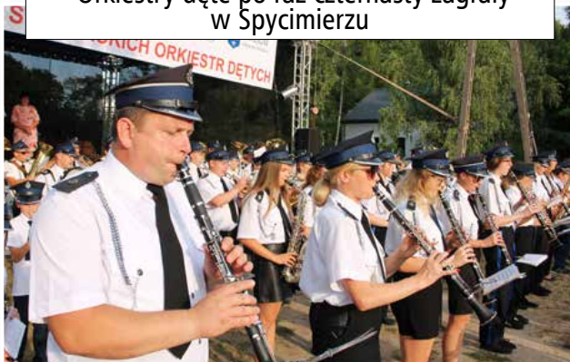
Orkiestry dęte po raz czternasty zagrały w Spycimierzu