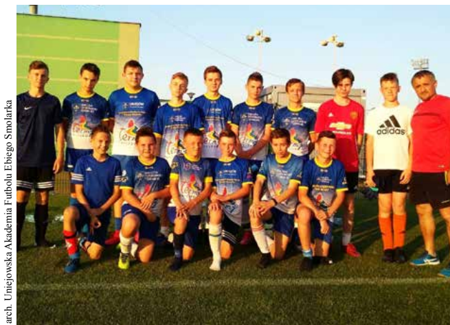
Reprezentacja rocznika 2005-2006