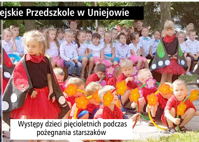
Występy dzieci pięcioletnich podczas pożegnania starszaków