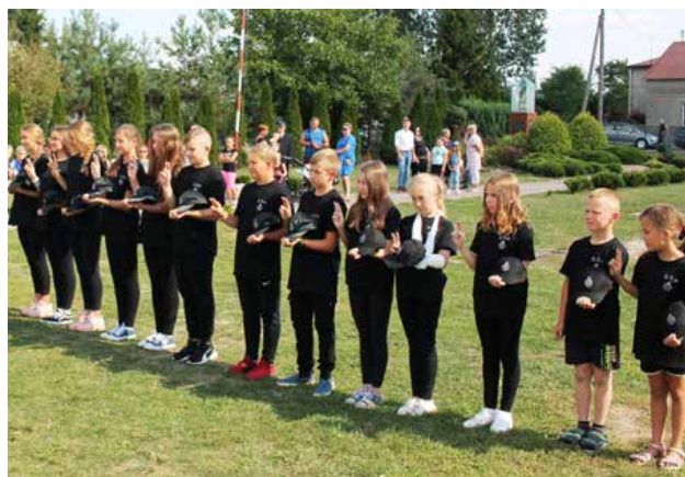
Adepci Młodzieżowej Drużyny Strażackiej, działającej przy OSP Roźniatów, składają ślubowanie podczas uroczystości w Roźniatowie pn. „Straż bez granic”.

to ciągłe zabieganie o dotacje, w zasadzie na wszystko: mundury, wyżywienie na pikniku, ewentualne nagrody, czy opłacenia, chociaż symbolicznie, artystów uatrakcyjniających swoimi występami imprezy. Sam nie wiem, jakim cudem udaje się skompletować drużynę do wyjazdu alarmowego, bo większość młodych ochotników gdzieś pracuje. Do utrzymania organizacji dochodzą opłaty za energię elektryczną, za węgiel do ogrzania obiektu. Stowarzyszenia płacą tak, jak firmy. Aby poradzić sobie z rozliczeniami, często korzysta się z usług biura rachunkowego, a to też kosztuje. Jednym słowem prezes stowarzyszenia, w szczególności prezes jednostki OSP, musi być totalnie pozytywnie zakręcony. Do swojej działalności przekonuje najbliższą rodzinę (żonę i dzieci), mieszkańców wsi i ewentualnych sponsorów. Tłumaczy się w urzędzie władzom OSP, PSP, własnej komisji rewizyjnej i samym członkom. Chwata wszystkim, którzy się tego podejmują. Pomagajmy im, doceniemy ich działalność, bo tych społeczników pozytywnie zakręconych jest coraz mniej.