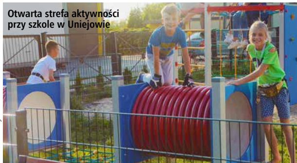
Otwarta strefa aktywności przy szkole w Uniejowie

Mamy nadzieję, że strefy, oprócz poprawy estetyki przestrzeni publicznej, będą aktywizować mieszkańców do wysiłku fizycznego oraz integrować wielopokoleniowe społeczeństwo z terenu gminy.