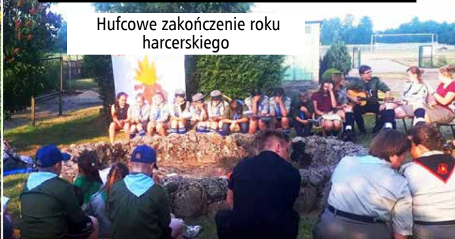
Hufcowe zakończenie roku harcerskiego