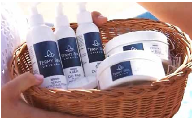
Najnowsza gama kosmetyków Termy Spa Uniejów