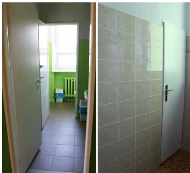
Odnowione sanitariaty w Wieleninie i Wilamowie