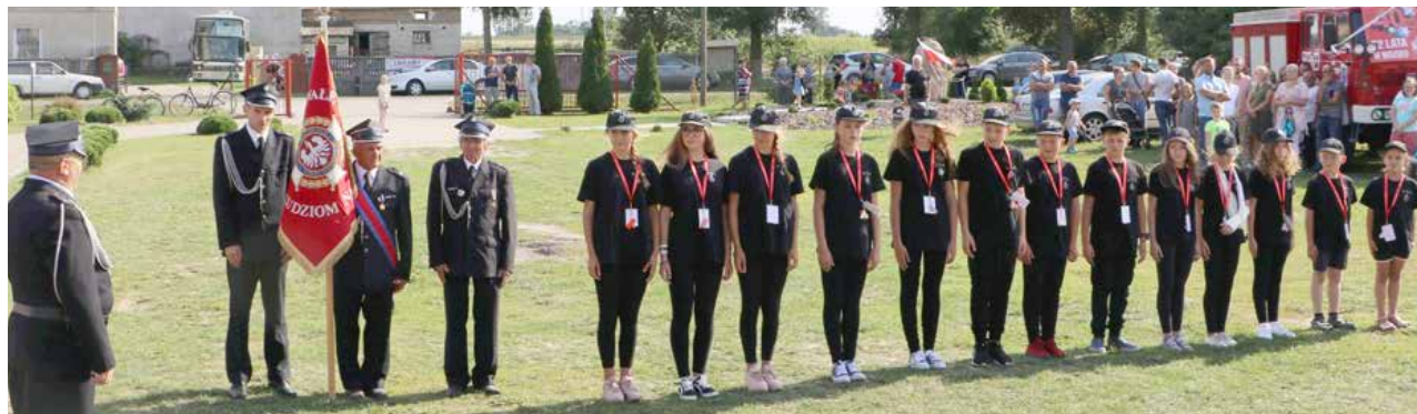
arch. R. Troczyński

Pietrzaka, Pani Prezes KGW „Roźniatowianki” wraz z Członkiniami Koła i wreszcie – mieszkańców sołectw z terenu działania jednostki – Roźniatowa i Roźniatowa Kolonii, Dąbrowy i części Kozanek, przyjezdnych gości i sympatyków Ochotniczych Straży Pożarnych.