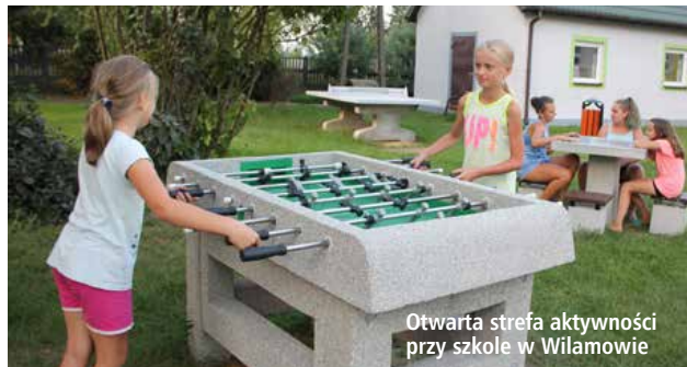
Otwarta strefa aktywności przy szkole w Wilamowie