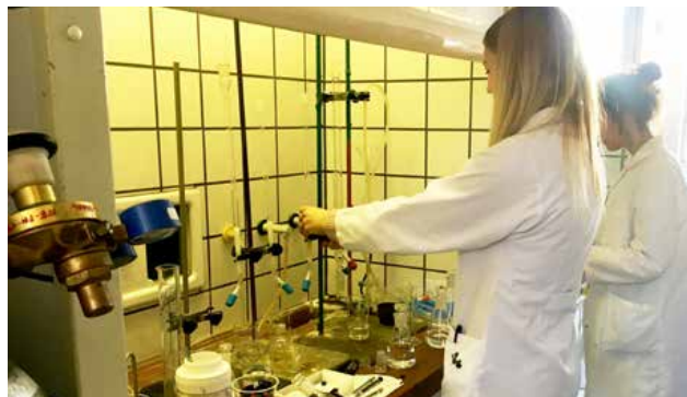
Badania prowadzone w Laboratorium Badawczym w Instytucie Biotechnologii Przemysłu Rolno-Spożywczego w Warszawie

Instytut prowadzi prace wdrożeniowe w wielu zakładach produkcyjnych w całej Polsce. Dzięki środkom przedsiębiorstw oraz projektów krajowych i unijnych jesteśmy w stanie podnieść poziom jakości produktów, jak i unowocześnić technologię produkcji danych artykułów spożywczych.