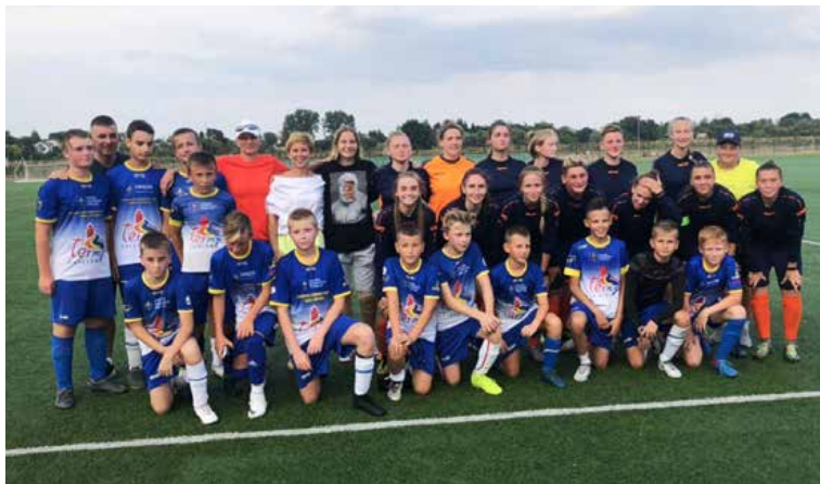
arch. A. Bednarkiewicz

Dziewczyny czuły się u nas bardzo dobrze. Zapytane, czy w następnym roku również planują przyjazd do Uniejowa, bez wahania odpowiedziały, że jeżeli tylko Pan Burmistrz wyrazi zgodę, z pewnością w następne wakacje zawitają do nas, aby trenować i poznać nowe drużyny z Uniejowa. Rozegrane mecze traktowały jako nowe wyzwania i wyciągnęły pozytywne wnioski, co jeszcze muszą u siebie podszkolić.