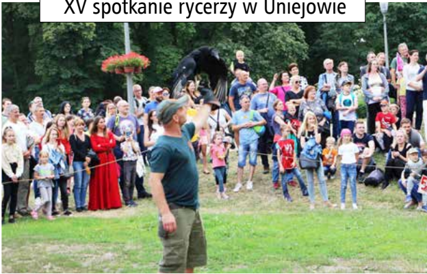
XV spotkanie rycerzy w Uniejowie