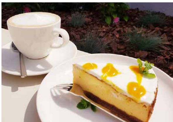
arch. LOKAL w Uniejowie