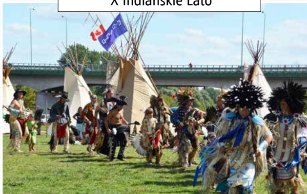
X Indiańskie Lato