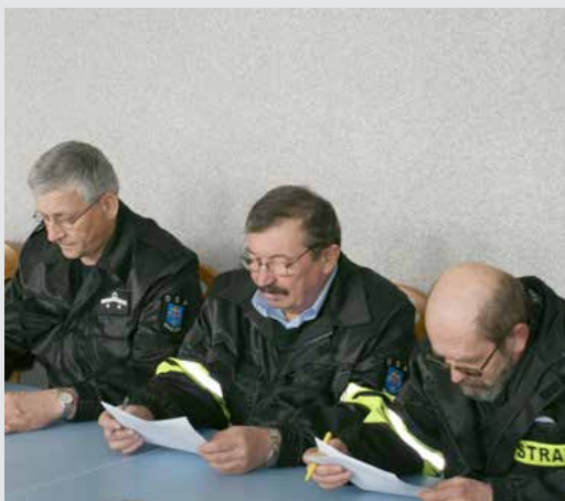
arch. OSP Uniejów