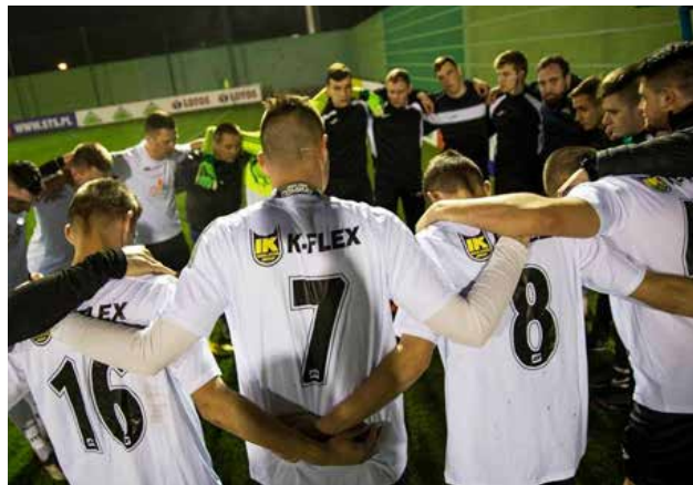
Drużyna MGLKS Termy Uniejów

Dokładny terminarz i wszelkie informacje z życia