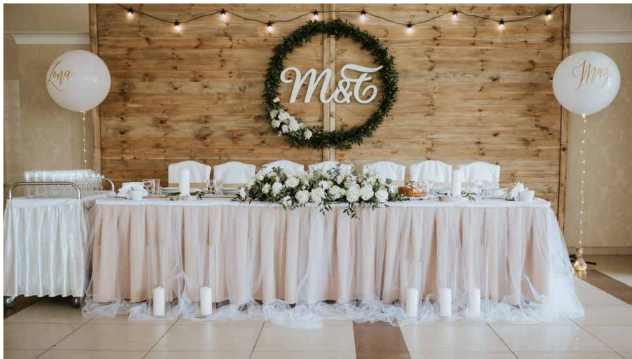
Dekoracja sali weselnej