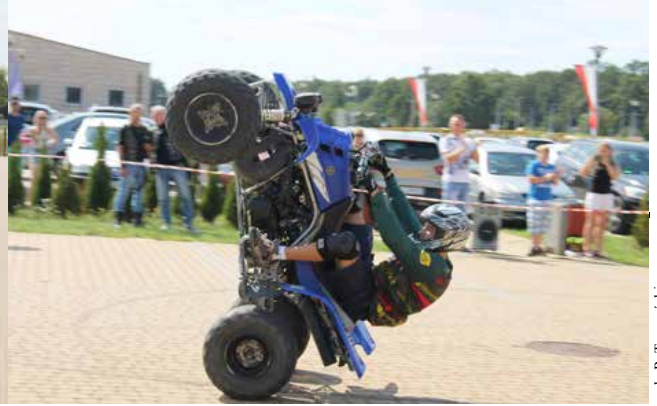
arch. R. Trzczyński