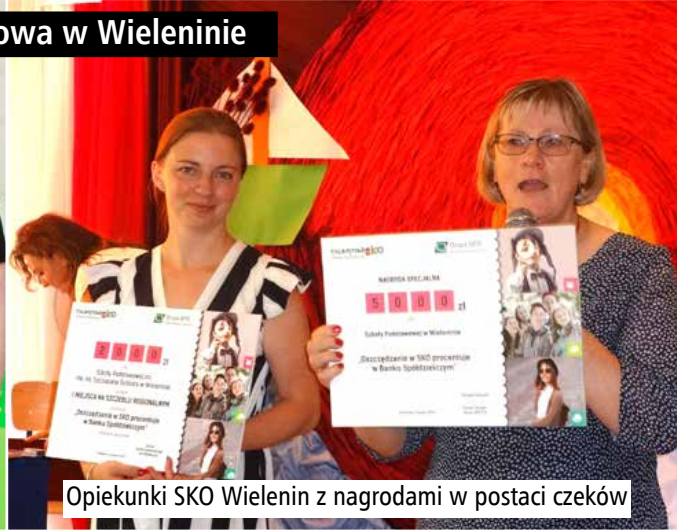
Opiekunki SKO Wielenin z nagrodami w postaci czeków