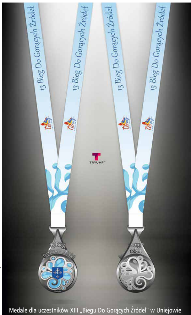
Medale dla uczestników XIII „Biegu Do Gorących Źródeł” w Uniejowie

Poczynania młodych uniejowskich piłkarzy można śledzić na stronie ŁZPN – zakładka: „Młodzież” oraz na Facebooku Uniejowskiego Stowarzyszenia Aktywni.