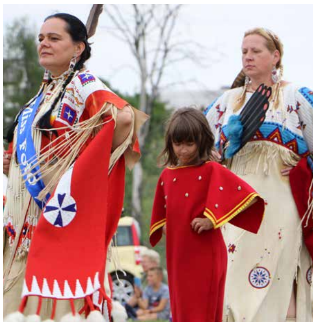
X Indiańskie Lato