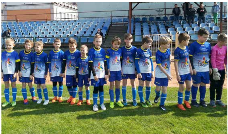
Reprezentacja rocznika 2009-2010

W sezonie 2019/2020, w rozgrywkach ligowych Łódzkiego Związku Piłki Nożnej, pod nazwą klubową TERMY Uniejów/Ostrowsko, udział wezmą cztery reprezentacje z Uniejowa: „Trampkarz” – rocznik 2005/2006, „Młodzik” – rocznik 2007/2008,