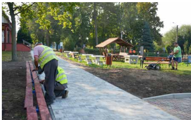
Położona kostka i instalowane ławki przy szkole w Uniejowie

Wybierając sale wzięto pod uwagę spostrzeżenia nauczycieli na podstawie ich codziennej obserwacji dzieci, czym zajmują się po szkole, czy w przerwach międzylekcyjnych. Wynika z nich, że dzieci wybierają aktywności sportowe, malują, rysują albo po prostu chcą odetchnąć i odpocząć. Do tej pory nie było w szkole np. przestrzeni, gdzie mogłyby zawisnąć prace plastyczne, wykonywane poza zajęciami, a niektóre z nich