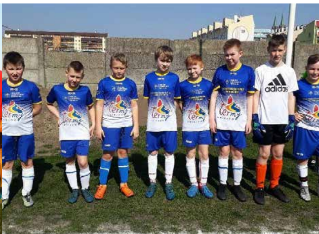
Reprezentacja rocznika 2007-2008