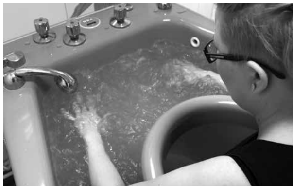
Zabiegi balneoterapeutyczne w Uzdrowisku Uniejów Park

Jesteśmy także dumni z organizacji turnusów przygotowujących do samodzielnego odchudzania – w Polsce na każdym kroku spotyka się „turnusy odchudzające” trwające 2-3 tygodnie, po których faktycznie ma się niższą wagę, niemniej, kiedy wracamy do swoich starych nawyków żywieniowych – wraca także waga, czyli pojawia się tzw. efekt jo-jo. Naszym celem jest natomiast nauka nawyków żywieniowych skutkująca trwałą utratą wagi. Chcemy pokazać naszym Gościom, jak zadbać o swoje zdrowie oraz zmniejszyć szkodliwy wpływ, jaki niesie za sobą nadwaga i otyłość. Muszę przy tym zaznaczyć, że nie chcemy oduczać jedzenia czegokolwiek – wszystko jest dozwolone, natomiast musi być odpowiednio zbilansowane. W Uzdrowisku Uniejów Park wykorzystywane są również najnowocześniejsze i uznawane za najskuteczniejsze