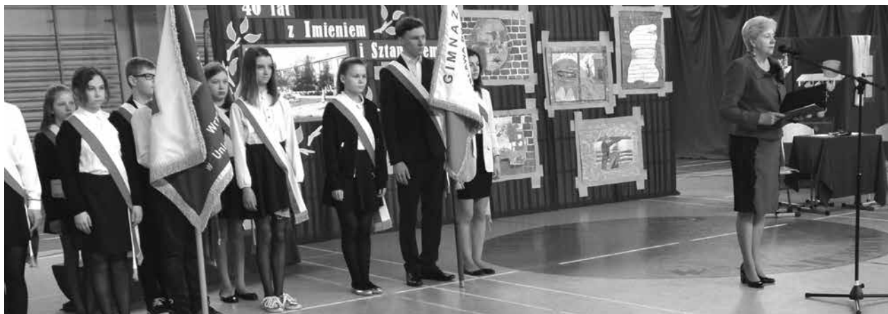
arch. ZS w Uniejowie