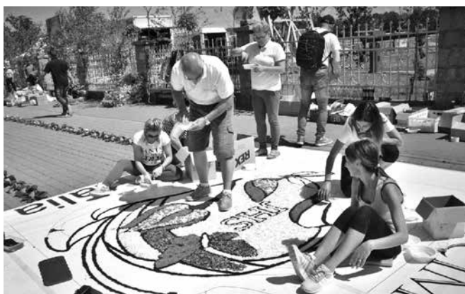
Włosi pracują nad kwietnym dywanem przed uroczystością Bożego Ciała w Spycimierzu