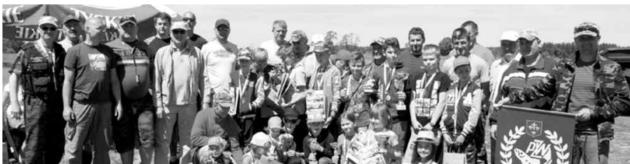
arch. M. Kubacki

Wszystkim, którzy przyczynili się do tej imprezy - dziękujemy w imieniu dzieci.