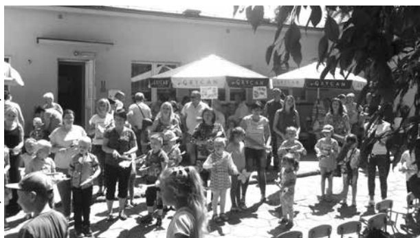
Zabawy podczas Festynu Rodzinnego

zabawy i szaleństwa była sala zabaw z tradycyjnym basenem z kulkami, zjeżdżalnią, wspinaczkami i innymi atrakcyjnymi zabawkami. Chętne dzieci mogły konstruować budowle z kolorowych klocków, inne tańczyć do muzyki z bańkami mydlanymi. Po posiłku, pełni wrażeń, zmęczeni, ale we wspaniałych humorach wróciliśmy do Uniejowa. Tam już na dzieci czekali utęsknieni rodzice.