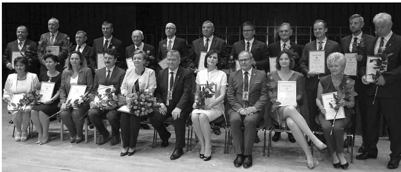
arch. Urząd Marszałkowski Woj. Łódzkiego