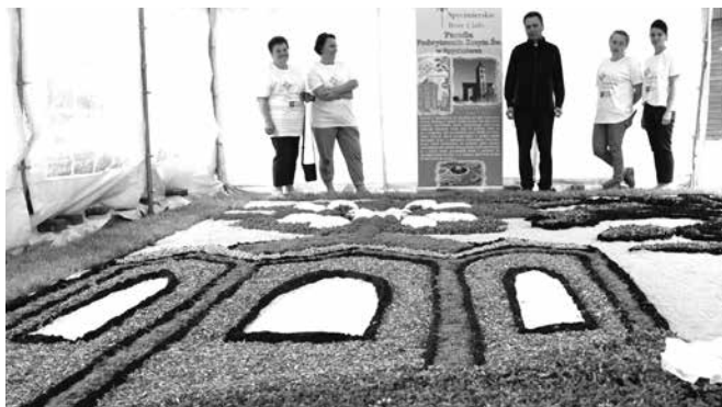
Dywan ułożony przez mieszkańców Spycimierza

Natomiast 15 czerwca przypadała uroczystość Bożego Ciała, która corocznie jest szczególnie obchodzona w Parafii Spycimierzu. Od rana parafianie, zgodnie z ponad 200 letnią tradycją, układali różnokolorowe dywany z żywych kwiatów na trasie procesji, która przeszła po Mszy św. o godz. 17.00. Ułożone, piękne dywany wzbudzały, jak zawsze, ogromny podziw i zdumienie licznie przybyłych na uroczystość gości.