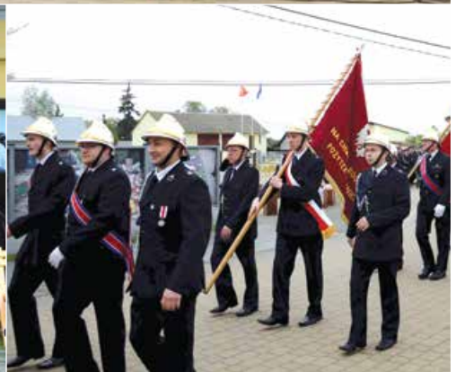
Międzypowiatowe Ćwiczenia Jednostek PSP i OSP w Uniejowie