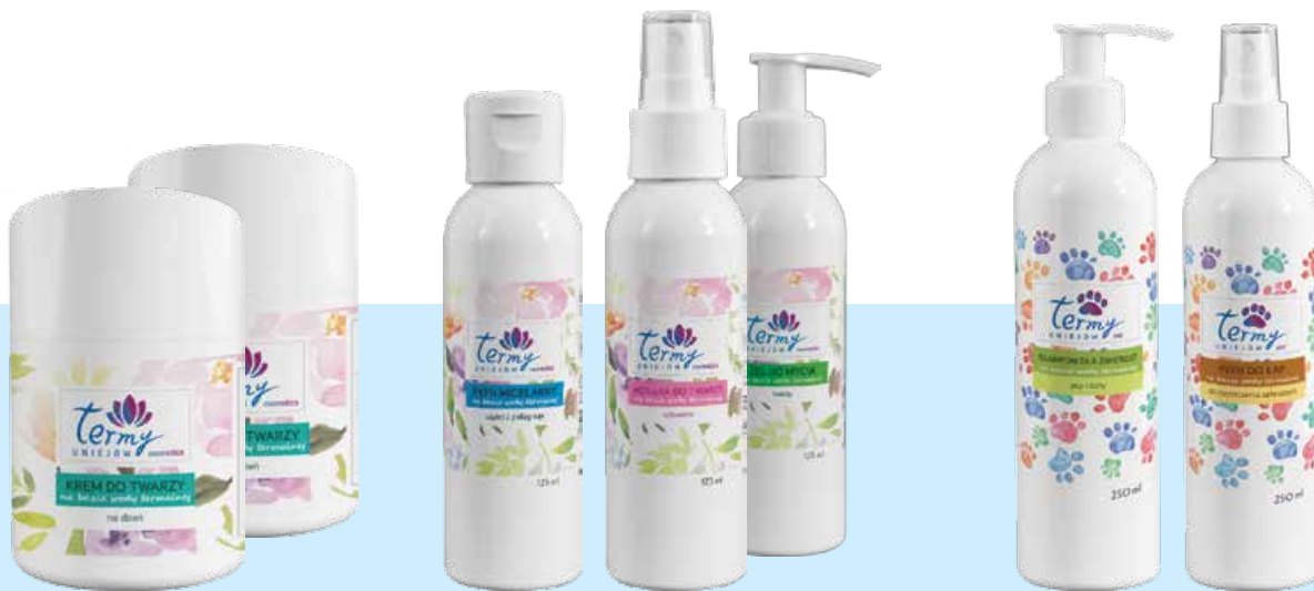
Krem do twarzy na dzień na bazie wody termalnej z Term Uniejów

Pierwsza linia kosmetyków opartych na bazie wody termalnej z Uniejowa