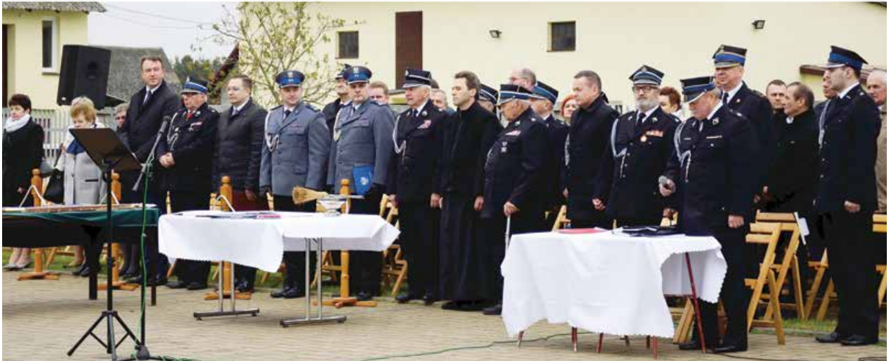
Jubileusz 90-lecia Ochotniczej Straży Pożarnej w Spycimierzu połączony z poświęceniem i przekazaniem nowego sztandaru oraz obchodami Gminnego Dnia Strażaka