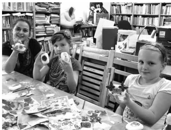
Przygotowane samodzielnie prezenty