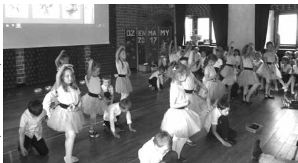
Taniec „Laleczka z porcelany” wykonany przez dzieci 6-letnie podczas Koncertu z okazji Dnia Matki