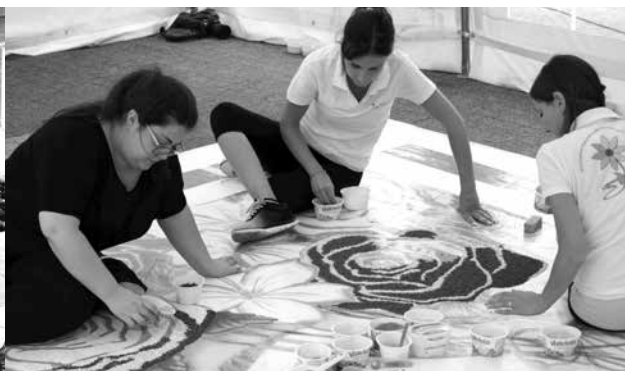
Członkowie Stowarzyszenia „Infioritalia” usypują obraz z pyłu kwiatowego podczas weekendu polsko-włoskiego