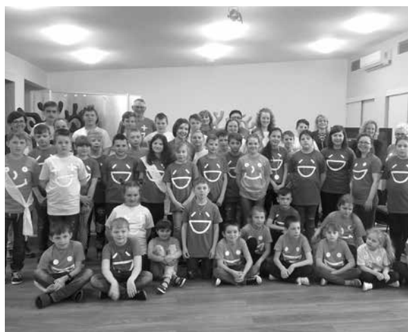
Pożegnanie z Wisłą – uczestnicy turnusu, przedstawiciele Fundacji ING Dzieciom oraz opiekunowie