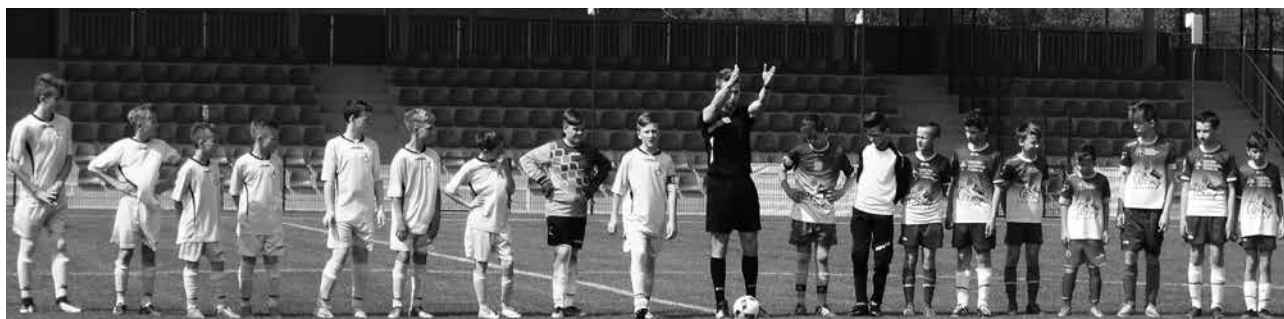
Piłkarze z rocznika 2005 pokazali ogromną wolę walki i spore umiejętności w meczu z Akademią Tuszyn