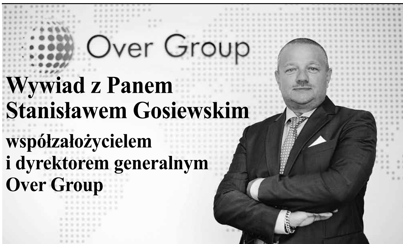
arch. S. Gosiewski