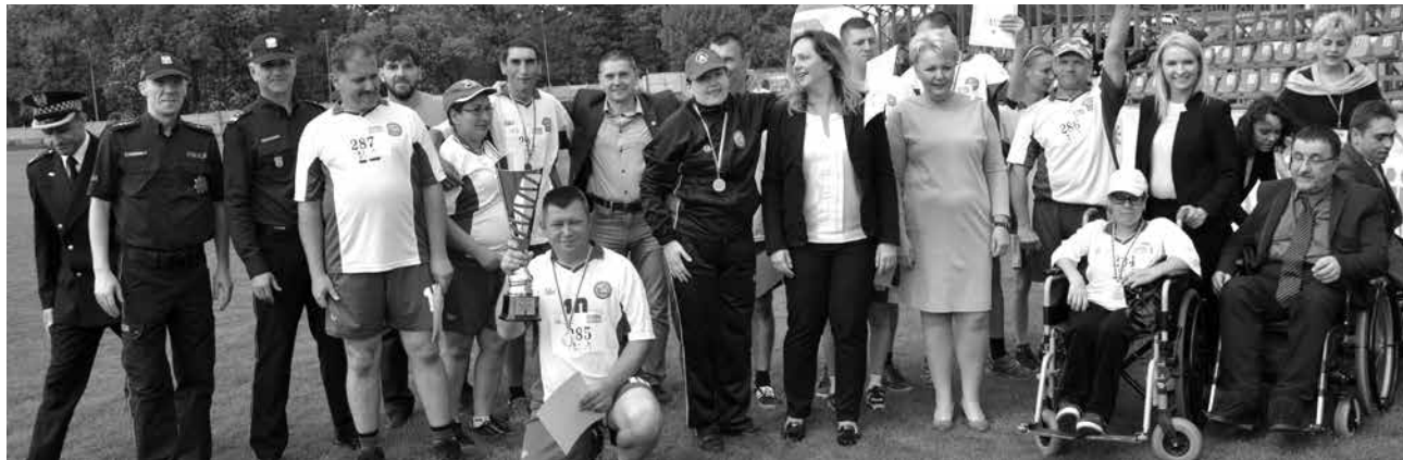
Najlepsza ekipa zawodów wraz z gośćmi