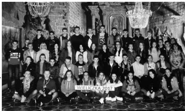
arch. ZS w Uniejowie