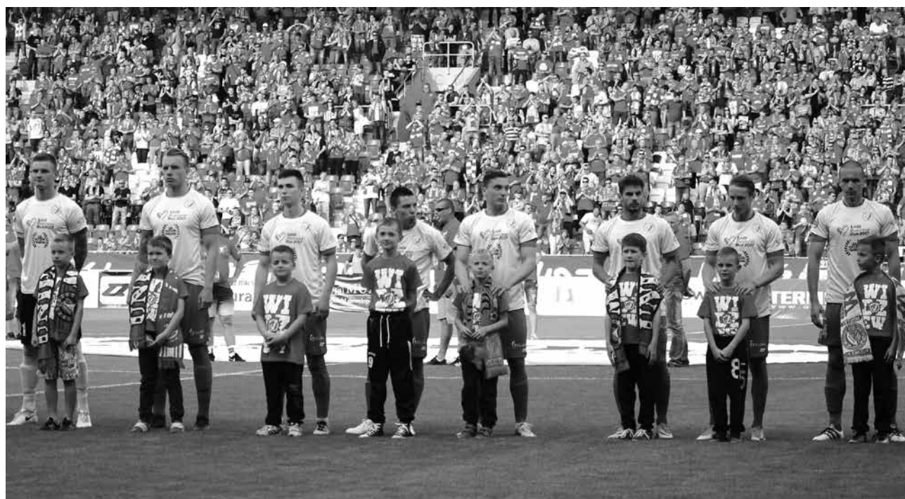
Asysta dzieci Uniejowskiej Akademii Futbolu