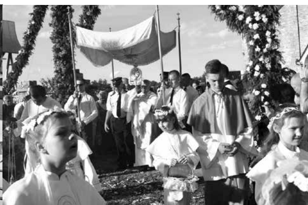
Procesja w święto Bożego Ciała w Spycimierzu