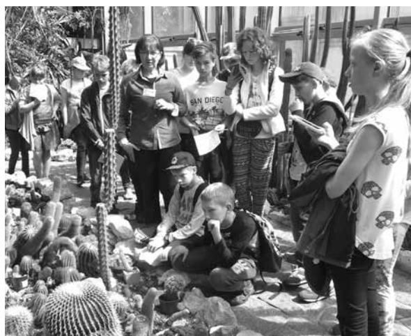
Uczestnicy wycieczki do Palmiarni w Łodzi w ramach projektu ekologicznego „W obronie Ziemi”