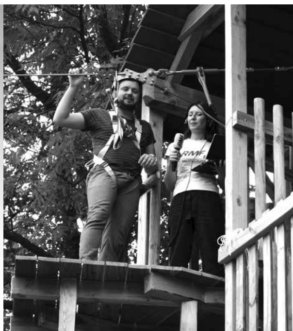
arch. UM Uniejow

Otwarcie parku to dodatkowa atrakcja dla najmłodszych. To właśnie z myślą o dzieciach został otwarty mini park linowy o długości trasy 82 metry, składający się z 10 domków drewnianych zamontowanych na naturalnym drzewostanie poddanych kontroli dendrologicznej oraz pracom arborystycznym. Drewniane domki zostały zamontowane metodą ściskanych belek nośnych wokół pnia drzewa, na których znajdują się deski stanowiące podłogę domku. Pomiędzy poszczególnymi stanowiskami wykonane zostały na wysokości ok. 1,5 m zestawy przeszkód linowych zabezpieczone siatkami asekuracyjnymi. Trasa mini parku linowego kończy się zjeżdżalnią. Obiekt przeznaczony jest dla dzieci w wieku 3-13 lat. W parku obowiązuje ruch jednokierunkowy. Z kolei dla starszych powstały dwie trasy parku linowego na dwóch poziomach wysokości.