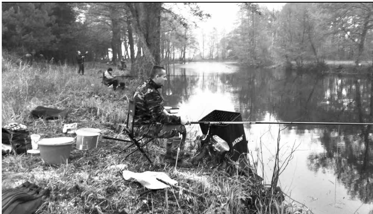
arch. Kolo Wędkarskie nr 16 w Uniejowie