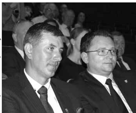
arch. Urząd Marszałkowski Woj. Łódzkiego