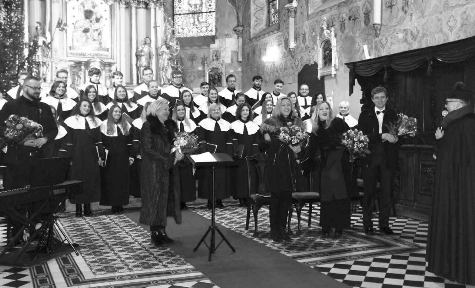
Uniejowskie Stowarzyszenie Aktywni