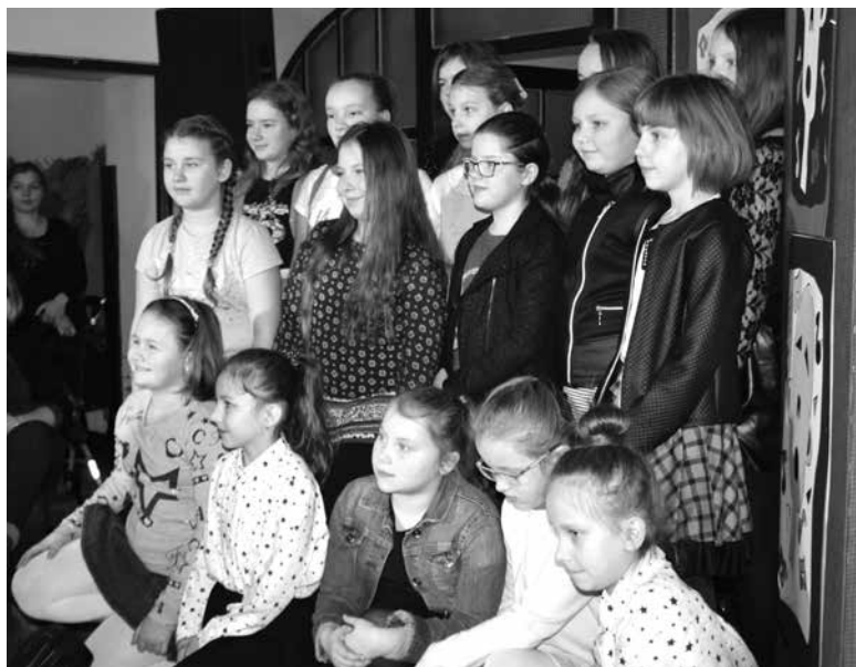
Uczestniczki festiwalu w kategorii klas IV-VI

Wsparcie finansowe: Miejsko-Gminna Komisja ds. Rozwiązywania Problemów Alkoholowych i Przeciwdziałania Narkomanii w Uniejowie.