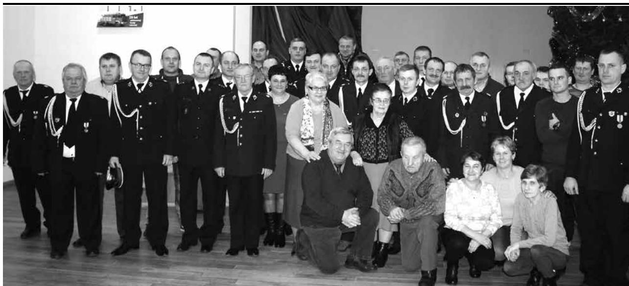
Walne zebranie OSP Wilamów