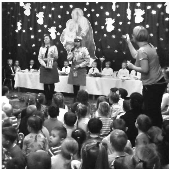
Przekazanie Światła w Miejskim Przedszkolu w Uniejowie