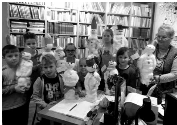
Zimowe bałwanki w miejskiej bibliotece w Uniejowie