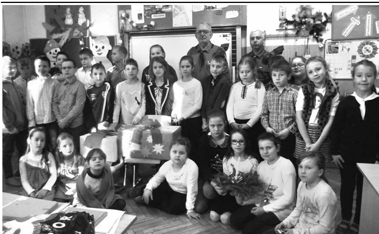
arch. ZS w Uniejowie