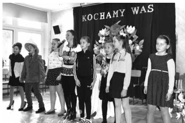
Występy uczniów w Dniu Babci i Dziadka