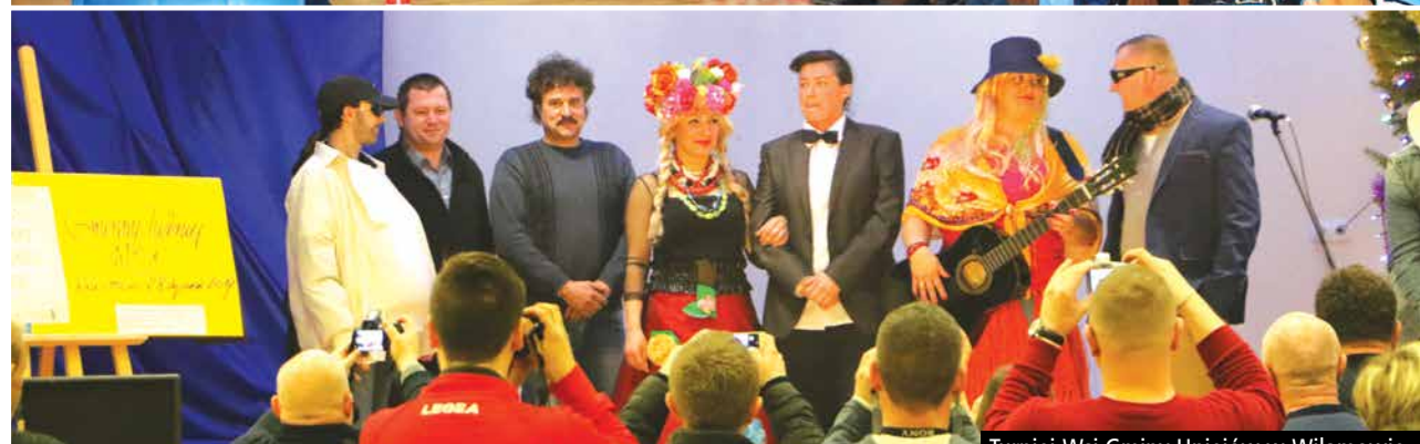
Turniej Wsi Gminy Uniejów w Wilamowie