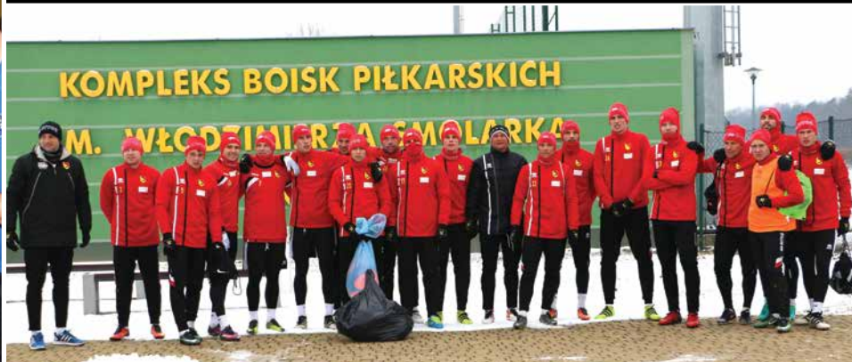
Trening drużyny piłkarskiej ekstraklasy - Jagiellonii Białostok na kompleksie boisk piłkarskich