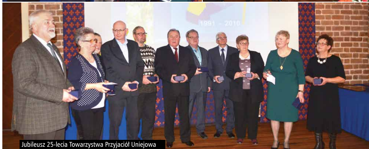
Jubileusz 25-lecia Towarzystwa Przyjaciół Uniejowa