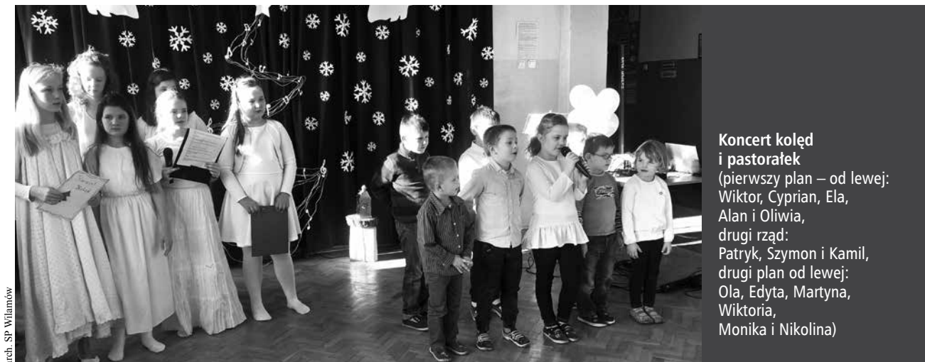
arch. SP Wilamów