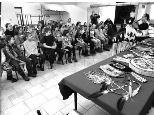
arch. Zespół Ranores