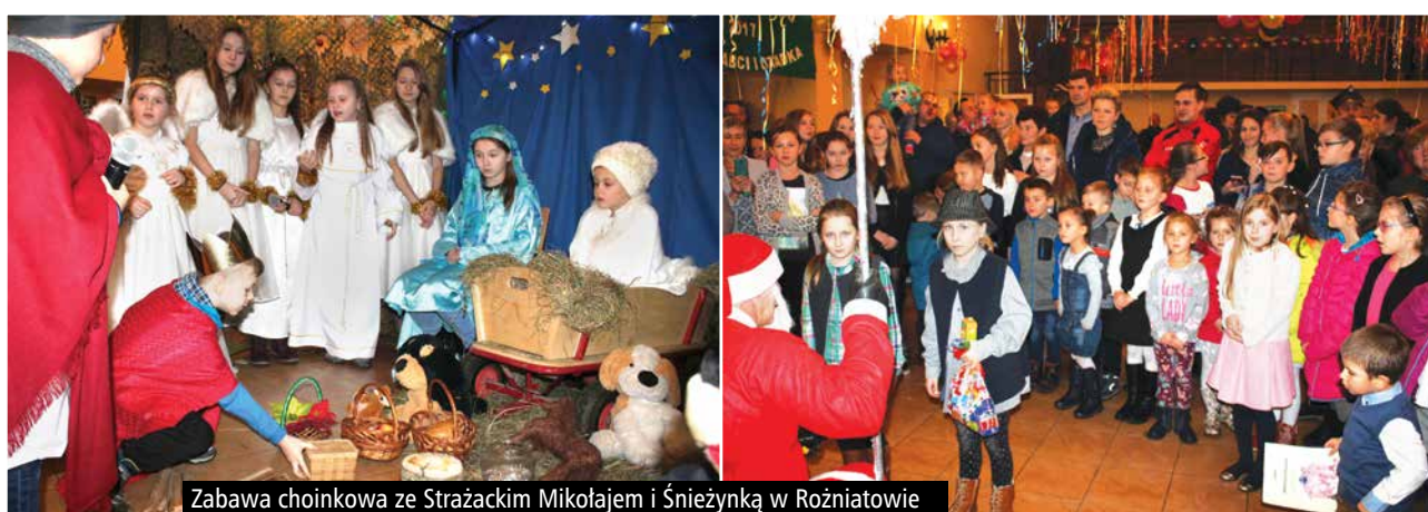
Zabawa choinkowa ze Strażackim Mikołajem i Śnieżynką w Roźniatowie