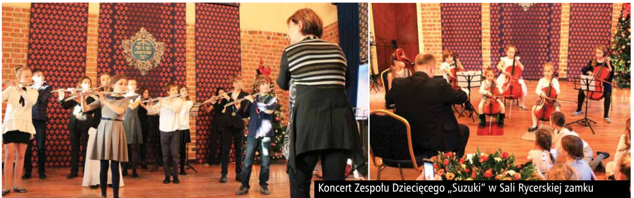
Koncert Zespołu Dziecięcego „Suzuki” w Sali Rycerskiej zamku