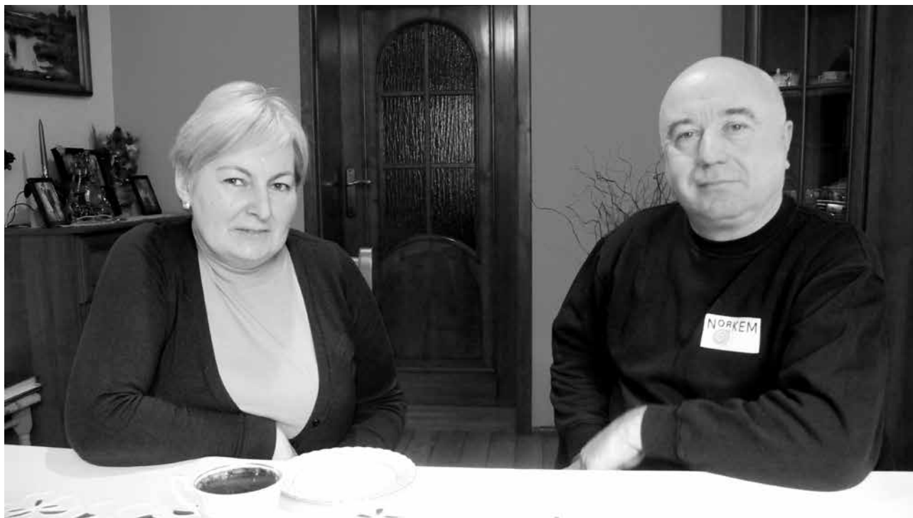
arch. R. Treczyński