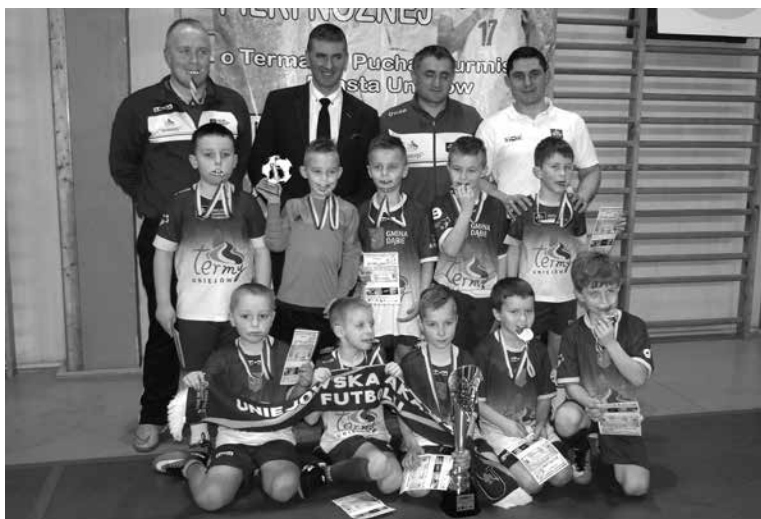
Zwycięska drużyna Termy Uniejów/Dąbie rocznik 2009