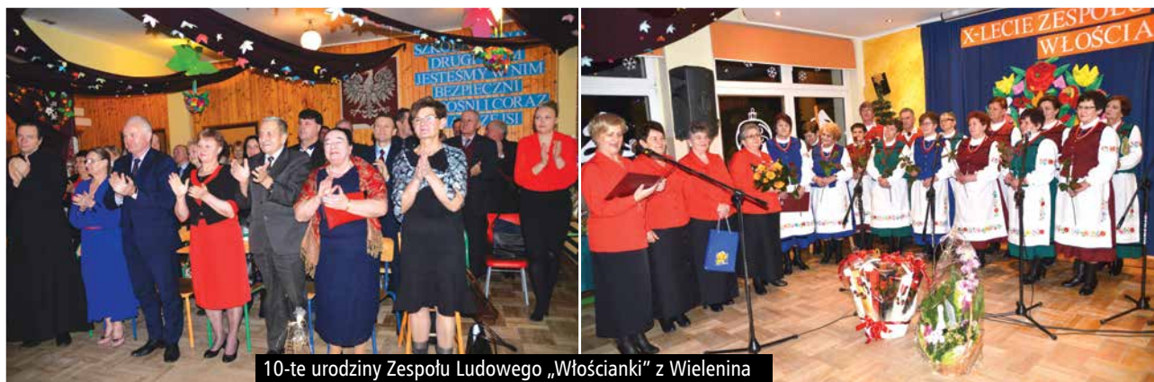
10-te urodziny Zespołu Ludowego „Włościanki” z Wielenina