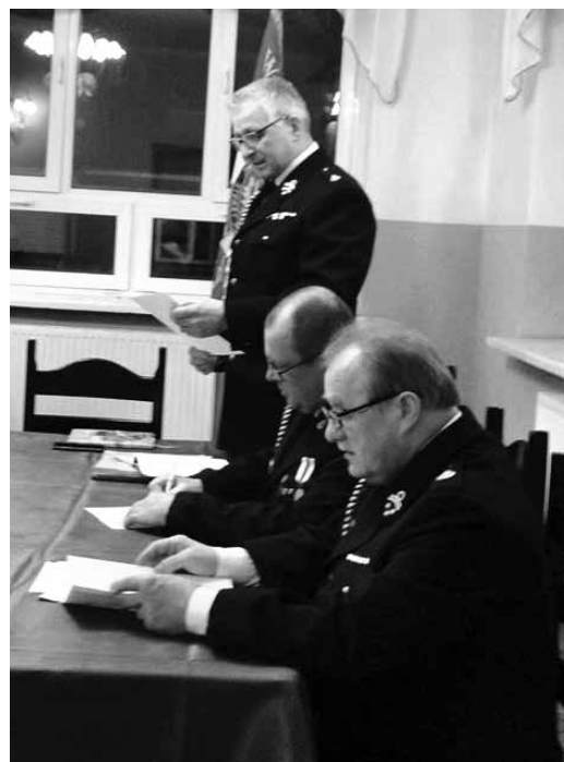
Walne zebranie OSP Uniejów

W bieżącym roku jednostka planuje m.in. kupić nowe stoły do sali OSP, pozyskiwać nowych członków, uczestniczyć w kolejnych szkoleniach podnoszących kwalifikacje i sprawność fizyczną strażaków.