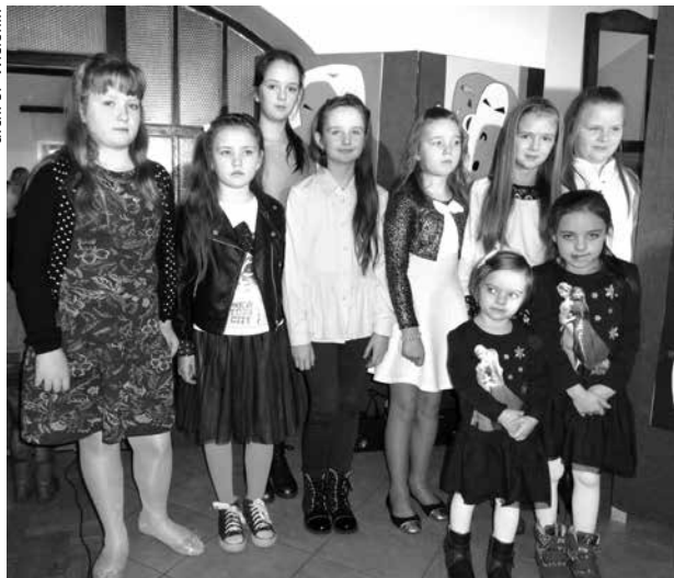
Talenty wokalne Szkoły Podstawowej w Wieleninie