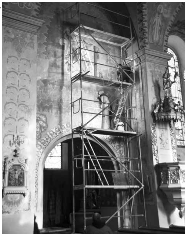
Badania konserwatorskie we wnętrzu uniejowskiej Kolegiaty w 2016 roku

obiektu. Całość wzniesiono na fundamencie z kamieni i cegieł. Ściany wymurowano z cegły palonej, układanej na wapiennej zaprawie. Elewacje boczne wzmocnione są uskokowymi przyporami, dzieląc płaszczyzny nawy głównej na trzy osie. Takie samo rozwiązanie konstrukcyjne, dotyczące wzmocnienia ścian, zastosowano w elewacji zachodniej, jak i od strony prezbiterium.