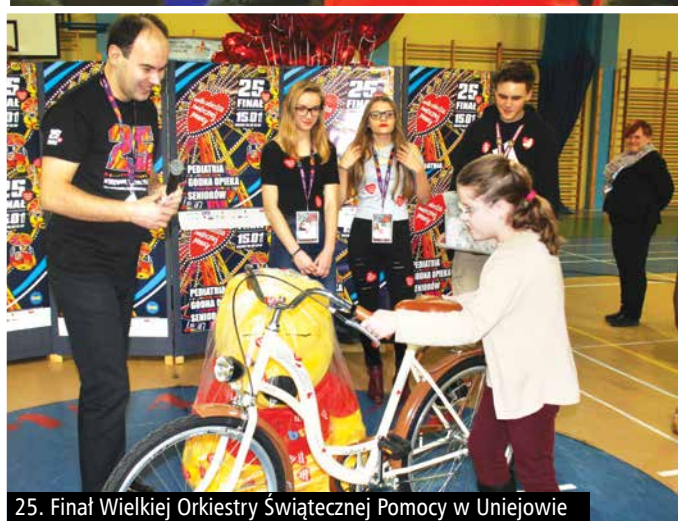
25. Finał Wielkiej Orkiestry Świątecznej Pomocy w Uniejowie