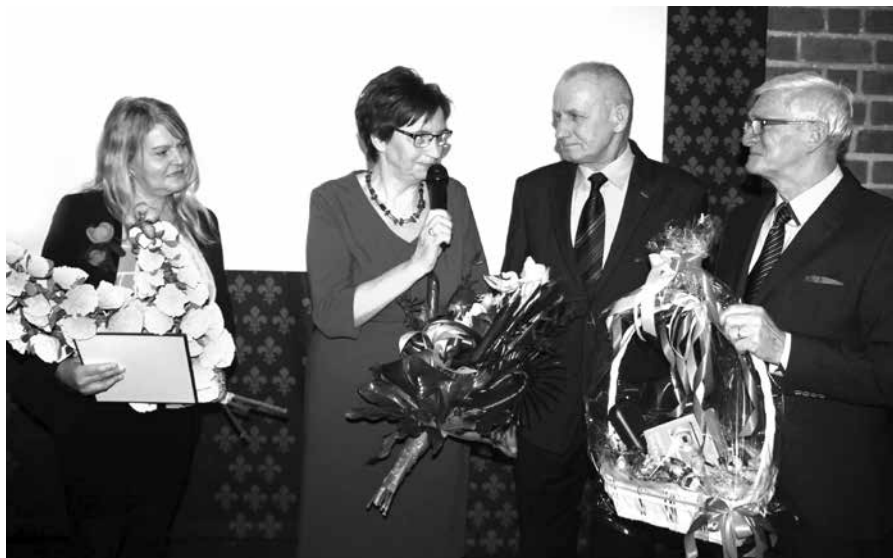
Przedstawiciele Zarządu TPU odbierają gratulacje od Przewodniczącego Rady Miejskiej w Uniejowie i Przedstawicielki Lokalnej Grupy Działania „Prym”