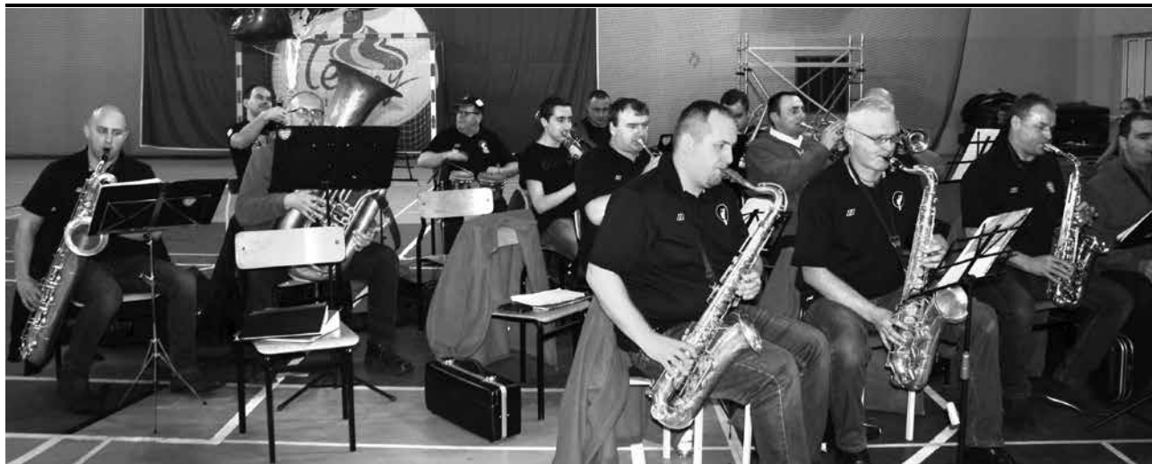
Występ Orkiestry Dętej Old Band Uniejów