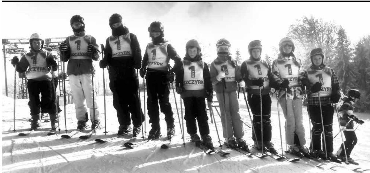
arch. ZS w Uniejowie