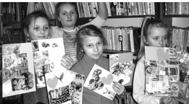
Laurki dla Babć i Dziadków