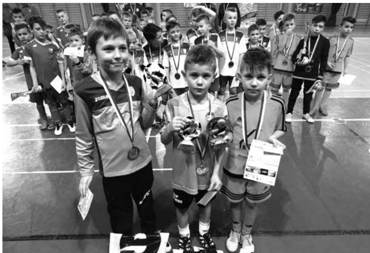
Najlepszy strzelec, najlepszy bramkarz, najbardziej wartościowy zawodnik z rocznika 2008