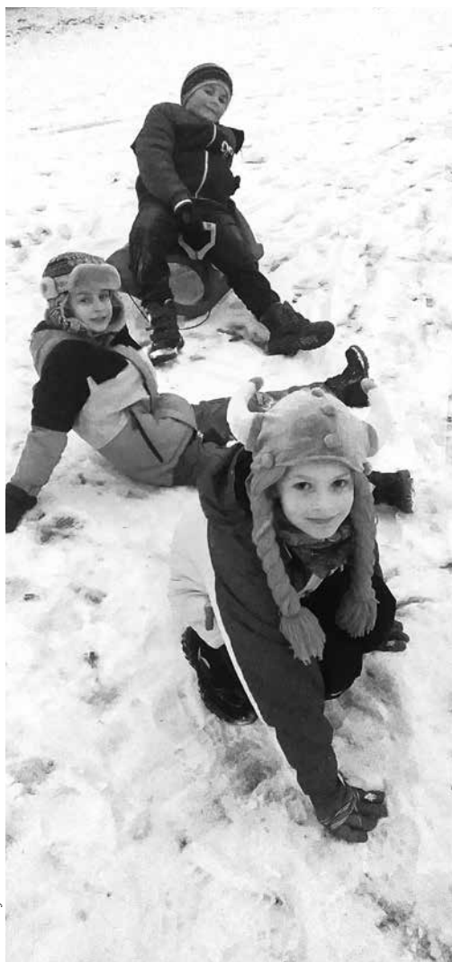
arch. Uniejowski Klub Karate Bassai

Tegoroczne ferie zimowe karatecy z Klubu BASSAI, jak zawsze, spędzili pracowicie. Dzieci i młodzież, która nie wyjechała na wypoczynek trenowała regularnie w klubie karate, choć atmosfera była luźniejsza niż zwykle. Zima była na tyle piękna i łaskawa pod względem temperatur, że jeden z treningów zorganizowaliśmy „w terenie”. Zabawa i duży wysiłek podczas wyścigów na sankach zapewniły atrakcje i trening w jednym.