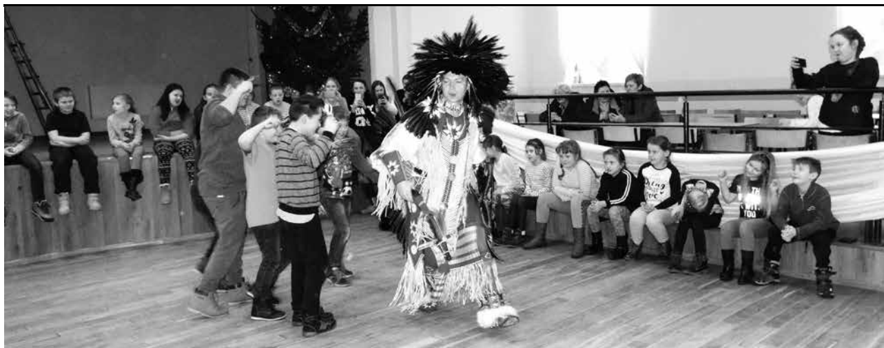
arch. Zespół Ranores

Noworoczne spotkanie zuchów i młodszych harcerzy z Hufca Uniejów odbyło się w tym roku z udziałem Indian w Wilamowie.