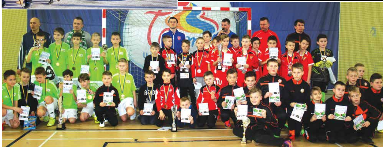
Ogólnopolski Turniej Halowej Piłki Nożnej „O Termalny Puchar Burmistrza Miasta Uniejów” TERMY CUP 2017