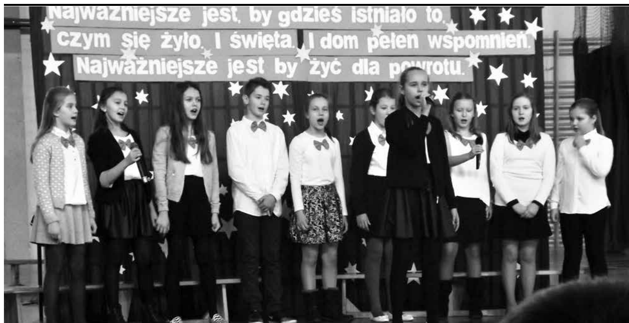
arch. ZS w Uniejowie