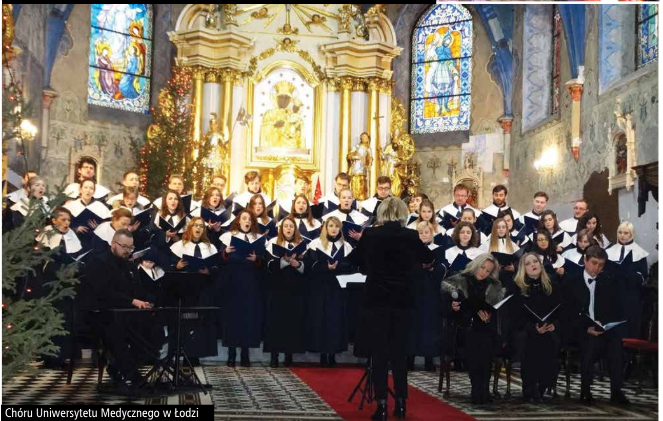
Chóru Uniwersytetu Medycznego w Łodzi