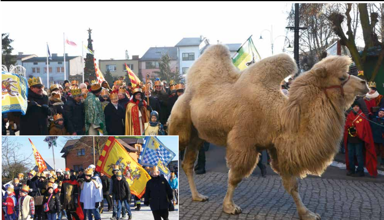
Orszak Trzech Króli w Uniejowie i Wilamowice