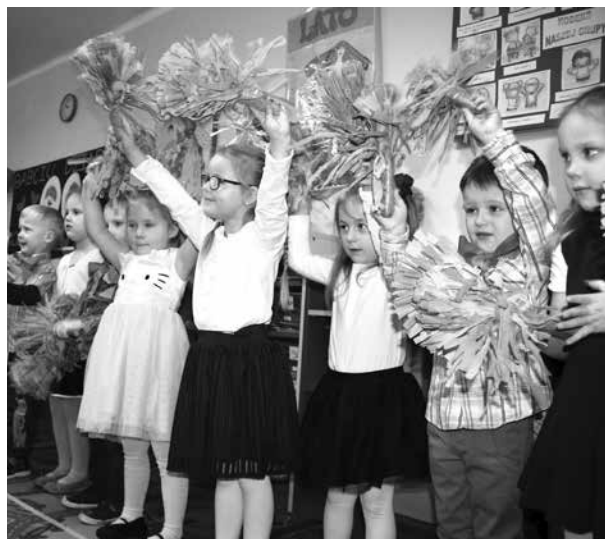
Występy Przedszkolaków z okazji Dnia Babci i Dziadka

Gratulujemy i życzymy dalszych sukcesów!