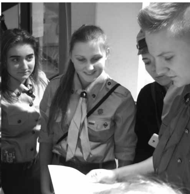
Delegacja pobierająca Światło w kłodzkiej Katedrze