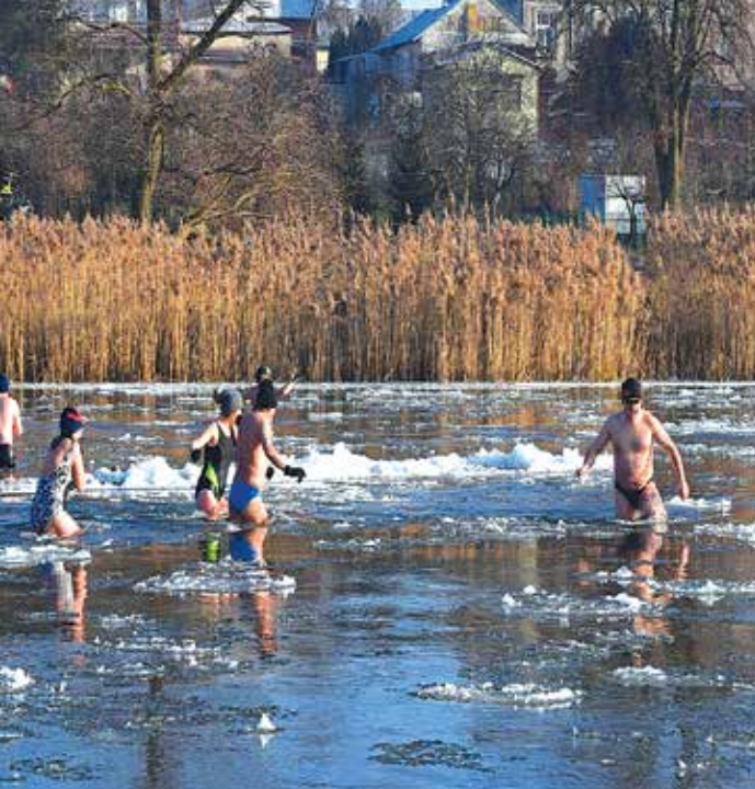
s. 59 Pobiliśmy mróz i rekord Guinnessa