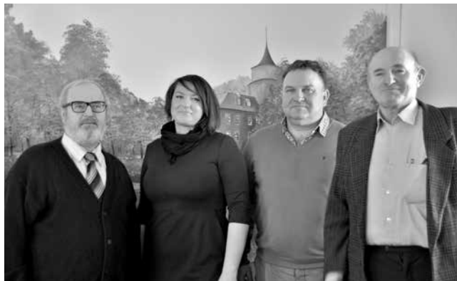
arch. UM Uniejów

Składamy gratulacje Pani sołtys i życzymy wielu sukcesów w pełnieniu tej funkcji.