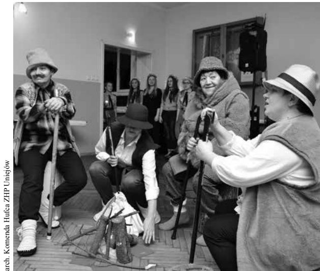
arch. Komenda Hufca ZHP Uniejów

najmłodszym zuchom i harcerzom, ale podarunkami zostali obdarzeni wszyscy, nawet ci starsi uczestnicy.