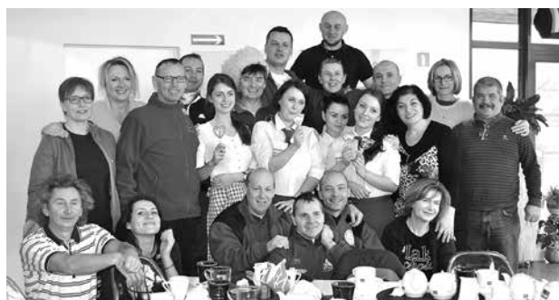
Walentynki w Restauracji Termalna Bistro&Cafe

Chciałabym zachęcić wszystkich, którzy się wahają, albo którzy uważają nas za dziwaków - powinni odważyć się na ten pierwszy raz. Na pewno nie pożałują, zwłaszcza, że przynależność do klubu jest zupełnie bezpłatna. Być może będą razem z nami uczestniczyć w cotygodniowych zimowych kąpielach.