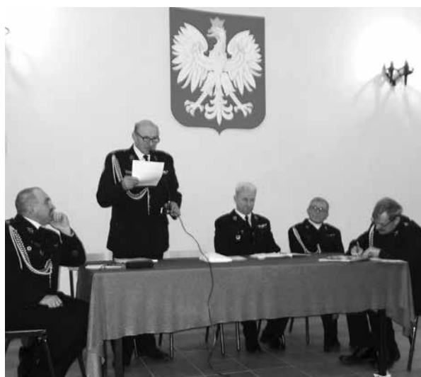
Walne Zebranie OSP w Roźniatowie