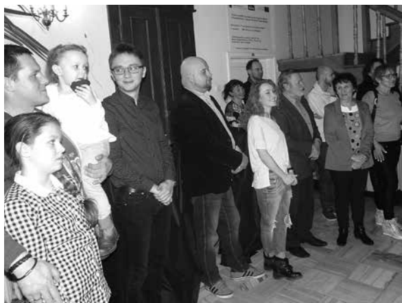
arch. A. Sobczak

Spektakl był oparty na autorskim scenariuszu, zainspirowany twórczością Edwarda Stachury i muzyką z najnowszej płyty zespołu „GREASEN”, działającego w domu kultury od kilku lat. Na potrzeby przedstawienia w sali kominkowej zbudowano scenę dostosowaną do potrzeb spektaklu. Pierwsze przedstawienie zatytułowane „Masz e-mail”, w tym samym składzie osobowym, odbyło się 14 lutego 2015 roku.