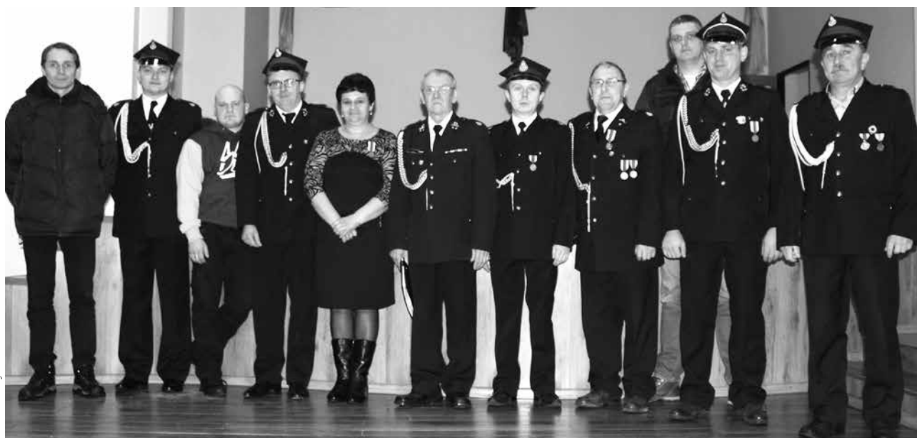
Wspólne zdjęcie starych i nowych władz jednostki

W wilamowskiej OSP dominują młodzi! W ostatnich latach przybyło wielu młodych druhów. Ukoronowaniem tego świeżego powiewu było ostatnie zebranie sprawozdawczo - wyborcze. Zarząd OSP Wilamów zdecydowanie się odmłodził - prawie sami 30-latkowie.