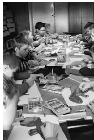
arch. MGOK Uniejów