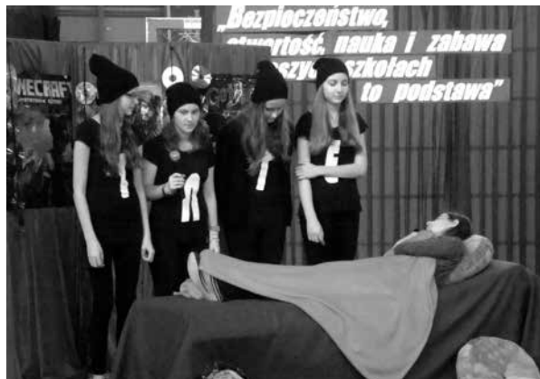
Spektakl „Oswajamy cyberprzestrzeń”