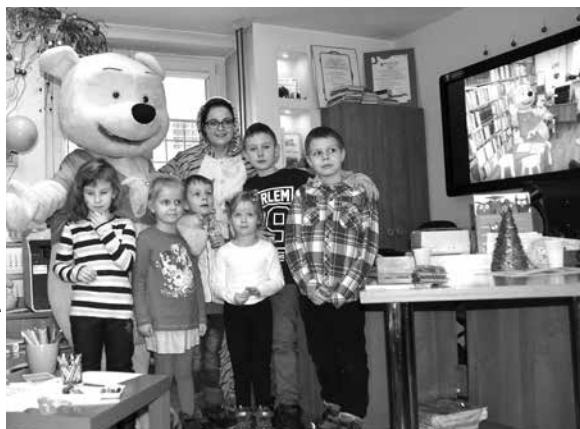
Dzieci z Puchatkiem i Tygrysiem

Akcja, mająca na celu popularyzację czytelnictwa wśród najmłodszych, poprzedzona była dzień wcześniej wizytą Puchatka w Zespole Szkół i Miejskim Przedszkolu w Uniejowie. Kubuś został przyjęty bardzo ciepło i serdecznie.