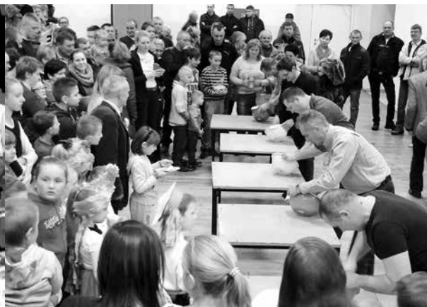
arch. R. Troczyński