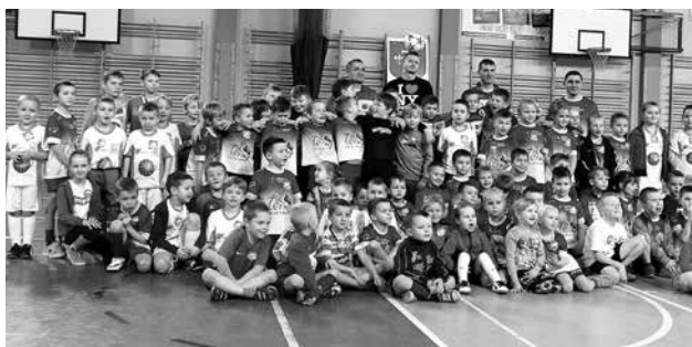
arch. Uniejowska Akademia Futbolu

Dziękujemy piłkarzom oraz ich wiernym kibicom za cały rok 2015 i życzymy udanego 2016 roku!