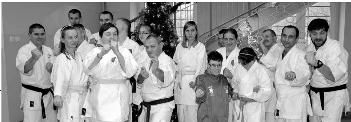
Zakończenie projektu „Droga Karate - Moją Drogą”