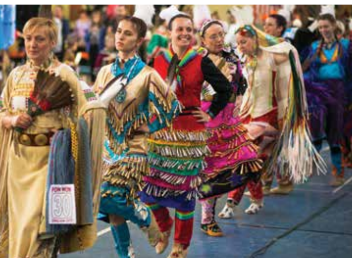
s. 66 Pow Wow time już 9 kwietnia 2016!