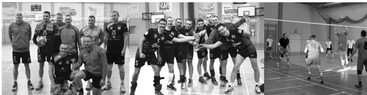
arch. A. Sobczak

Organizatorami turnieju byli: Urząd Miasta w Uniejowie, P.G.K. „Termy Uniejów” Sp. z o.o., Miejsko – Gminny Ośrodek Kultury w Uniejowie, Zespół Szkół w Uniejowie.