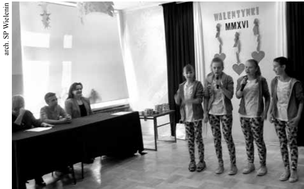
arch. SP Wielenin