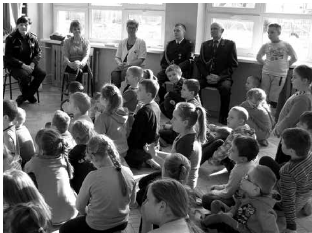
Goście uczestniczący w akcji „Poczytaj mi, proszę”

Na zakończenie były wspólne zdjęcia, a goście otrzymali podziękowania. Korzystając z okazji, pani policjantka przeprowadziła z dziećmi pogadankę dotyczącą bezpiecznego wypoczynku podczas zbliżających się ferii zimowych.