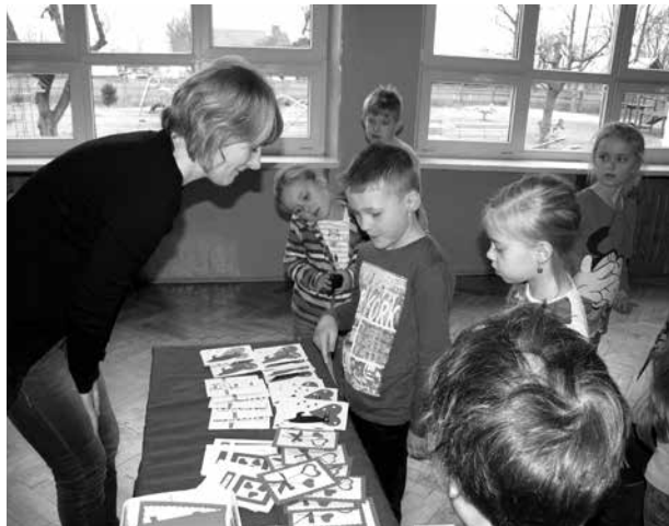
Sprzedaż kartek walentynkowych

VI przygotowali prezentacje multimedialne, które zaprezentowali w poszczególnych klasach, przeprowadzając pogadanki na temat bezpieczeństwa w Internecie oraz zasad, którymi należy się kierować podczas surfowania w sieci. Wyjaśnili też młodszym koleżankom i kolegom, gdzie można uzyskać pomoc w razie niebezpieczeństwa. Uczniowie dowiedzieli się, w jaki sposób każdy internauta może przyczynić się do tego, by Internet stał się miejscem bezpiecznym i pozytywnym. Podkreślono również, że każdy z nas ponosi odpowiedzialność za to, co robi w sieci i w jaki sposób z niej korzysta. Ponadto dzieci z klas II-VI wykonały efektowne prace plastyczne, które zostały umieszczone na gazetce.