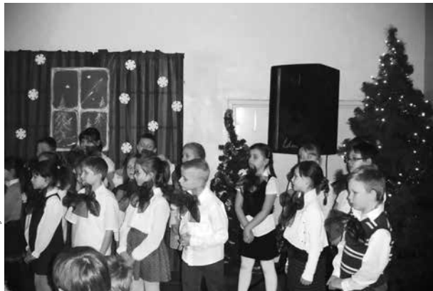
arch. ZS w Uniejowie