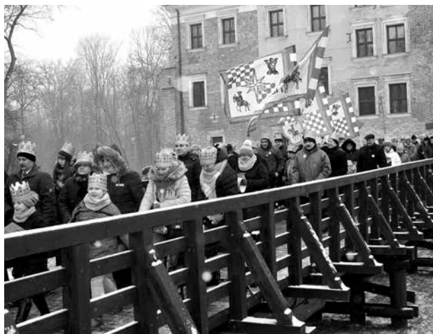
arch. A. Sobczak