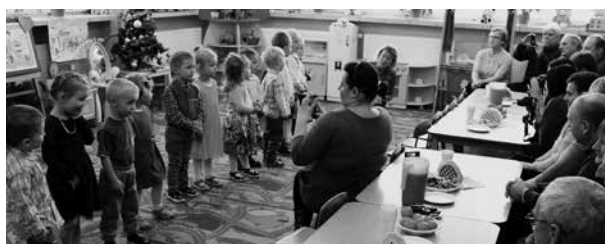
Dzień Babci i Dziadka

Występ uświetniły również piosenki śpiewane wspólnie oraz przez laureatów Festiwalu Piosenki o kobietach i dla kobiet.