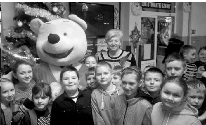
Kubuś w Zespole Szkół w Uniejowie