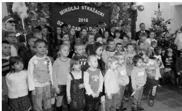
arch. W. Pawłowski