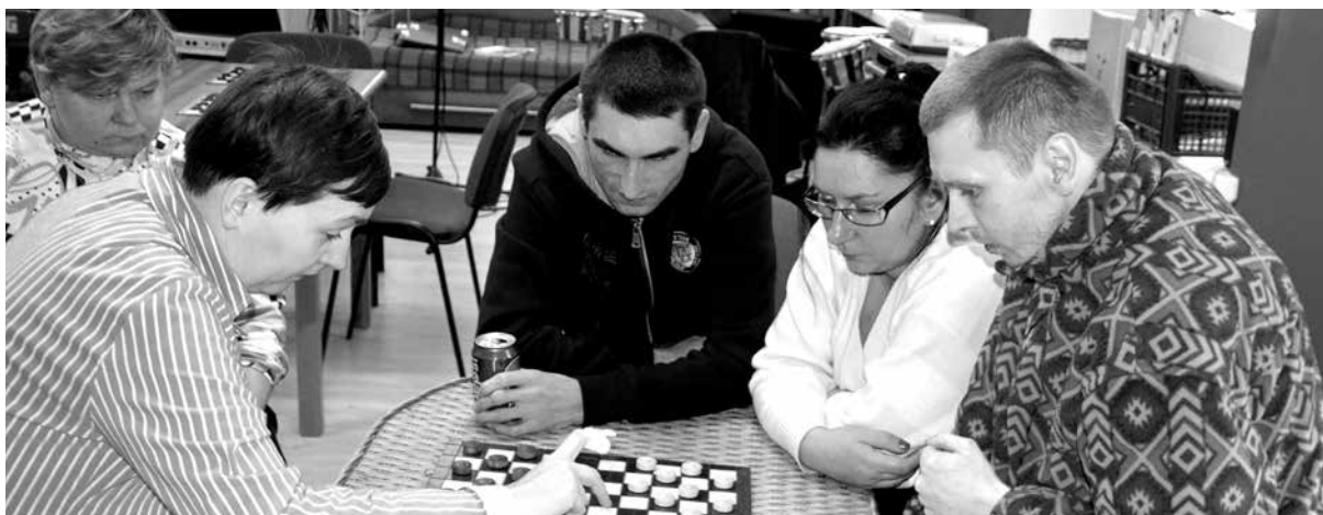
VII Igrzyska pod Dachem