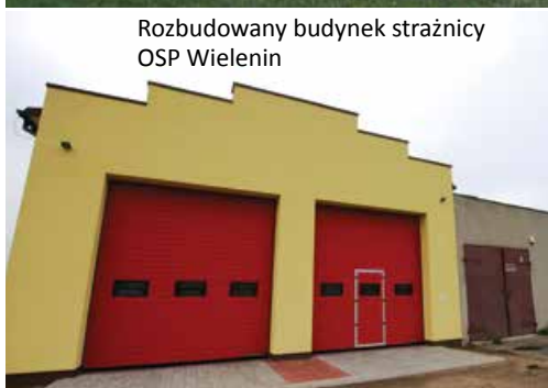
Rozbudowany budynek strażnicy OSP Wieleninie