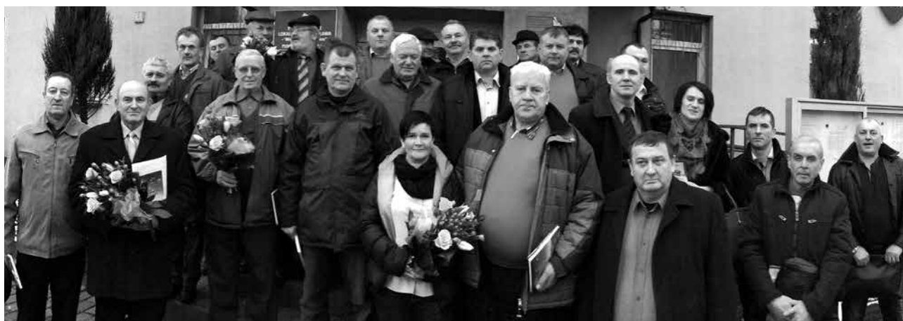
Sołtysi Gminy Uniejów