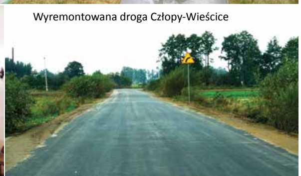
Wyremontowana droga Człopy-Wieścice