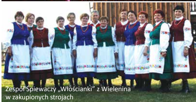
Zespół Śpiewaczy „Włościanki” z Wielenina w zakupionych strojach