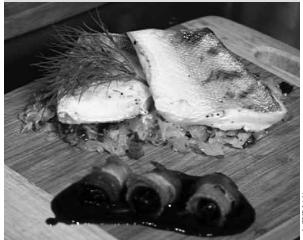
arch. TVP Łódź

Najpierw należy przygotować kapustę w następujący sposób: pokroić w drobną kostkę boczek i smażyć na patelni, następnie wrzucić do niego pokrojoną w piórka cebulę, czosnek i papryczkę chili. Smażyć do momentu zeszklenia się warzyw. Potem dodać pokrojoną kapustę kiszoną, chwilę smażyć i kolejno dodawać: żurawinę, miód, sok z połowy cytryny, a pod koniec świeżo zmielony pieprz i połowę masła. Dusić około 20 minut.