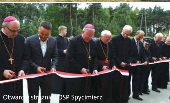
Otwarcie strażnicy DSP Spycimierz