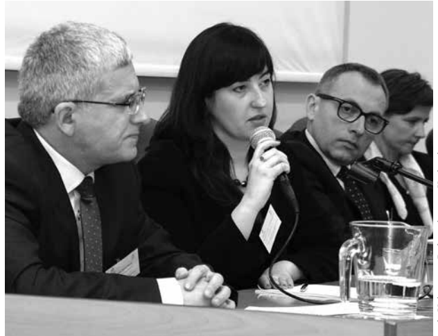
arch. Uniwersytet Pedagogiczny w Krakowie

Autorka jest absolwentką Wydziału Tkaniny i Ubioru w Akademii Sztuk Pięknych w Łodzi.