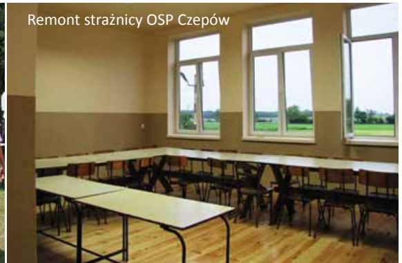
Remont strażnicy OSP Czepów