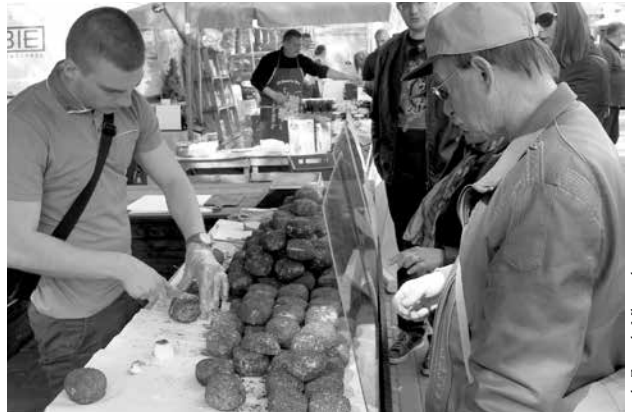
arch. Zagroda Mlynska

Serdecznie zapraszamy na kolejne jarmarki!