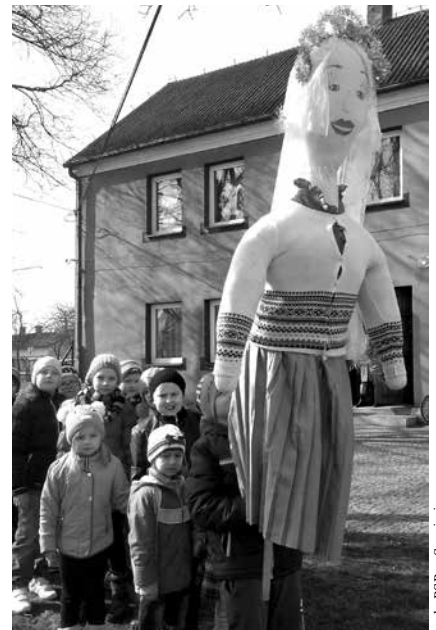
arch. PSP w Spycimierzu

20 marca 2015 r. dzieci brały udział w pogadance dotyczącej pór roku, a jednocześnie radośnie witanej wiosny. Zwróciły uwagę na zmiany zachodzące w przyrodzie m.in. budzenie się drzew po zimowej drzemce. Niektóre dostrzegły różnice w sposobie spędzania wolnego czasu. Jest to dobry moment na długie spacery z rodziną oraz jazdę na rowerze, wśród śpiewu ptaków i ciepła słonecznych promieni. Rozmowa była wstępem do radosnego świętowania z przyjścia nowej, kolorowej i zaczarowanej wiosny. W tym dniu dzieci wybrały się na spacer wraz z panną Marzanną, żegnając zimne zimowe dni. Z ciekawością spoglądały do ogródków, wypatrując pierwszych wiosennych kwiatów. Dalszą część dnia spędziły na placu zabaw, bawiąc się oraz kierując swój wzrok na puste gniazdo bocianów. Chętnie widziane ptaki zrobiły mieszkańcom miłą niespodziankę, przylatując w czasie Świąt Wielkanocnych. Ogromną radość sprawia widok nisko latających bocianów, tuż nad placem zabaw. Coraz cieplejsze dni będą okazją do dalszego ich obserwowania oraz spędzania czasu na placu szkolnym.