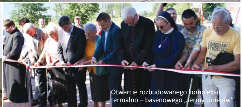
Otwarcie rozbudowanego kompleksu termalno – basenowego „Termy Uniejów”