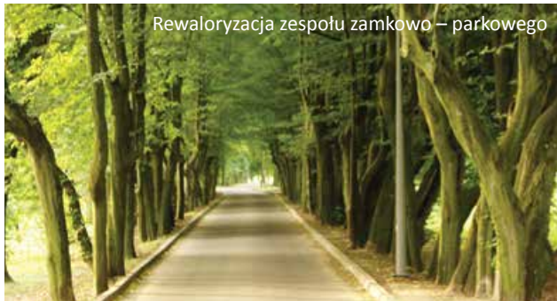
Rewaloryzacja zespołu zamkowo – parkowego