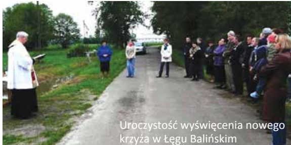
Uroczystość wyświęcenia nowego krzyża w Łęgu Balińskim