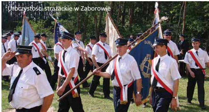
Uroczystości strażackie w Zaborowie