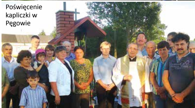
Poświęcenie kapliczki w Pęgowie