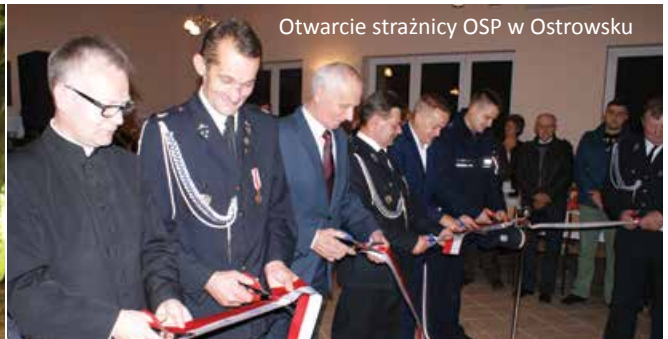
Otwarcie strażnicy OSP w Ostrowsku