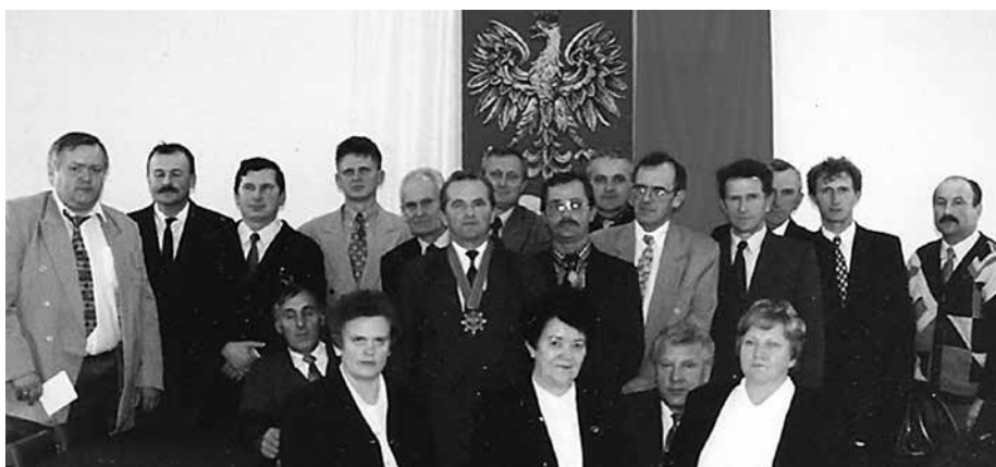
Władze Miasta i Gminy Uniejów III kadencji