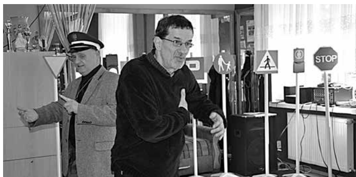
Tajemnice Miejskiej Dżungli