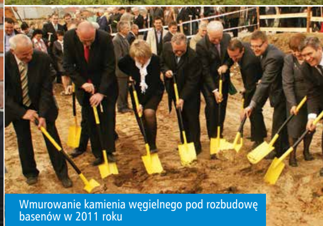
Wmurowanie kamienia węgielnego pod rozbudowę basenów w 2011 roku