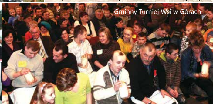
Gminny Turniej Wsi w Górach