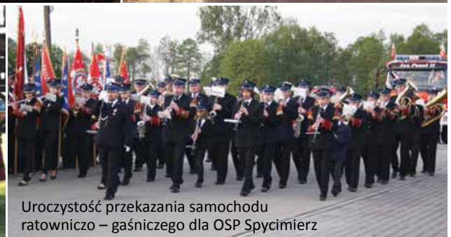
Uroczystość przekazania samochodu ratowniczo – gaśniczego dla OSP Spycimierz