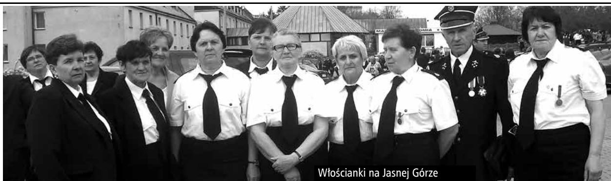
Włocianki na Jasnej Górze