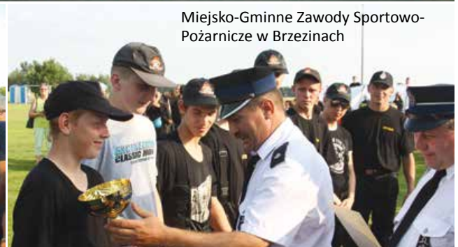
Miejsko-Gminne Zawody Sportowo- Pożarnicze w Brzezinach