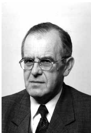
Burmistrz Eugeniusz Synakiewicz