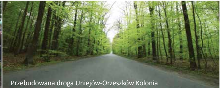
Przebudowana droga Uniejów-Orzeszków Kolonia