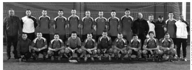
arch. MGLKS Termy Uniejów

Przed nami wiele spotkań, miejmy nadzieję, że uniejowska drużyna wygra jak najwięcej spotkań i sezon zakończy na jak najwyższym miejscu.