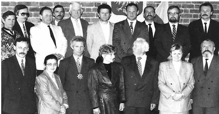
Władze Miasta i Gminy Uniejów I kadencji