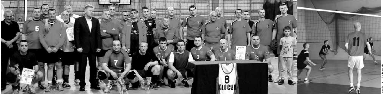
arch. A. Sobczak