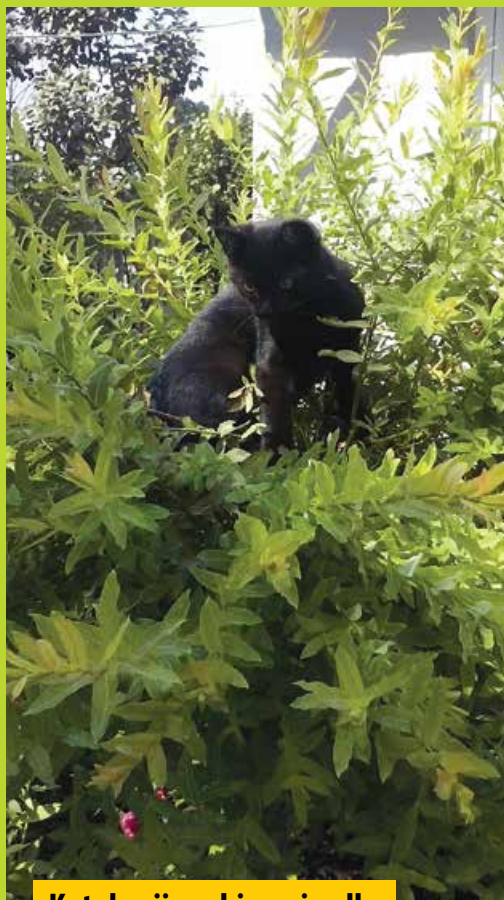
Kotek wije sobie gniazdko