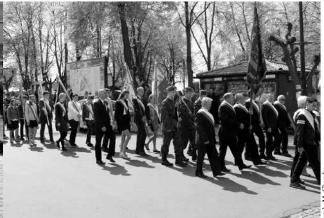
arch. M. Charruba