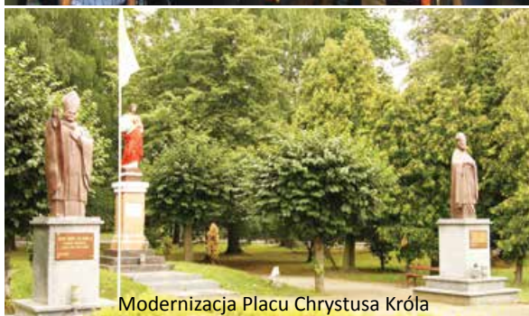
Modernizacja Placu Chrystusa Króla