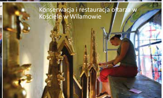
Konservacja i restauracja ołtarza w Kościele w Wilamowie