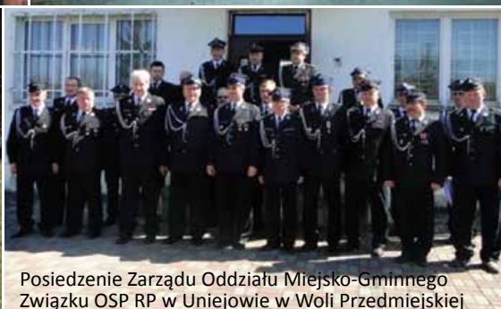
Posiedzenie Zarządu Oddziału Miejsko-Gminnego Związku OSP RP w Uniejowie w Woli Przedmiejskiej