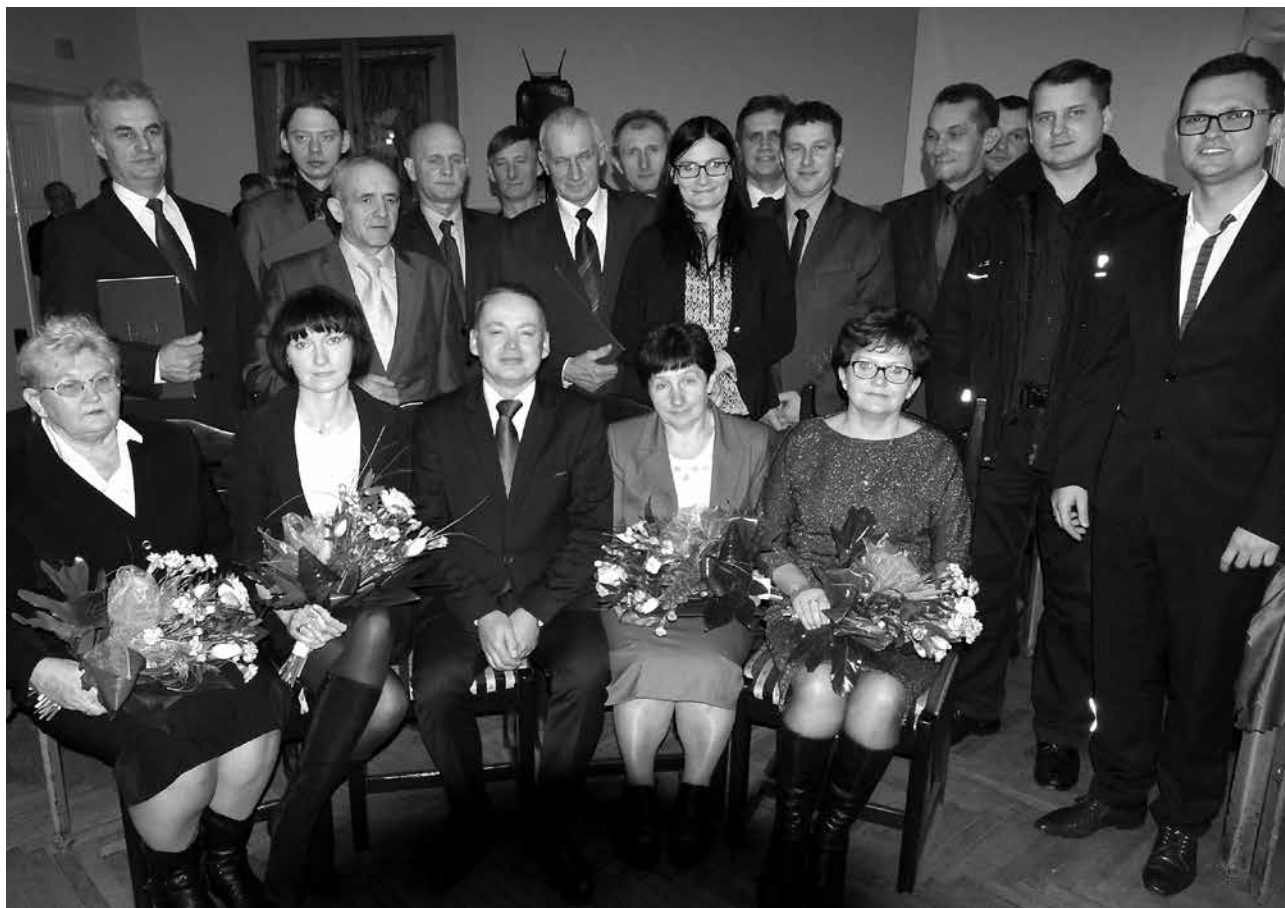
Władze Miasta i Gminy Uniejów VII kadencji