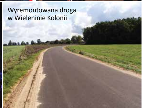
Wyremontowana droga w Wieleninie Kolonii