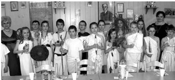
arch. SP Wielenin

Uczta trwała w najlepsze, kiedy nauczycielka prowadząca ukazała się z ekscytującą puszką. I podobnie, jak niegdyś w mitycznych czasach, bogowie okazali nadmierną ciekawość. Szczęśliwie puszka Pandory (bo o niej mowa) wypełniona była słodyczami i nie