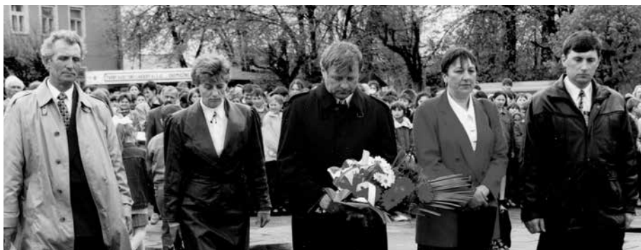
Władze Miasta i Gminy Uniejów II kadencji