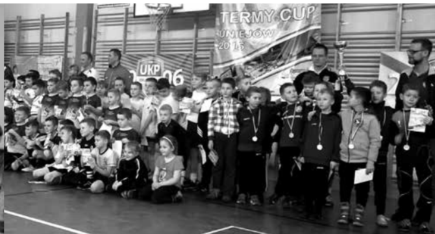
arch. Uniejowska Akademia Futbolu

Rywalizacja z takimi drużynami jak Widzew Łódź, czy Jagiellonia Białystok dała dużo satysfakcji i cennego doświadczenia młodym piłkarzom