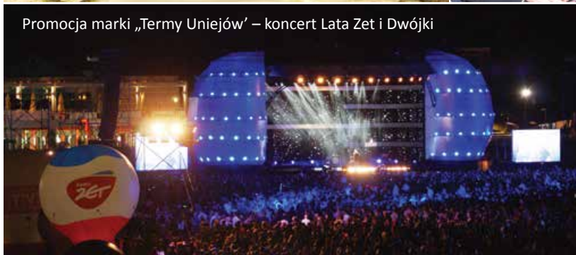
Promocja marki „Termy Uniejów” – koncert Lata Zet i Dwójki