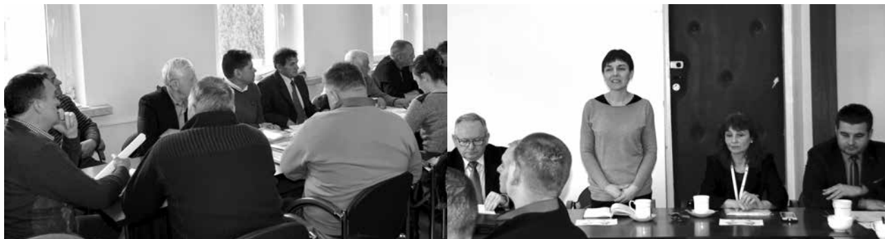
arch. UM Uniejów

Tematyka związana z rolnictwem pojawiła się także na zwołanej w tym samym dniu IX sesji Rady Miejskiej w Uniejowie, na której Rada przyjęła stanowisko dotyczące niekorzystnej sytuacji w rolnictwie.