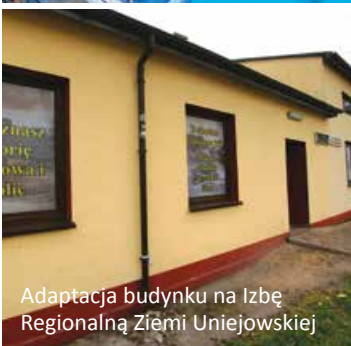
Adaptacja budynku na Izbę Regionalną Ziemi Uniejowskiej