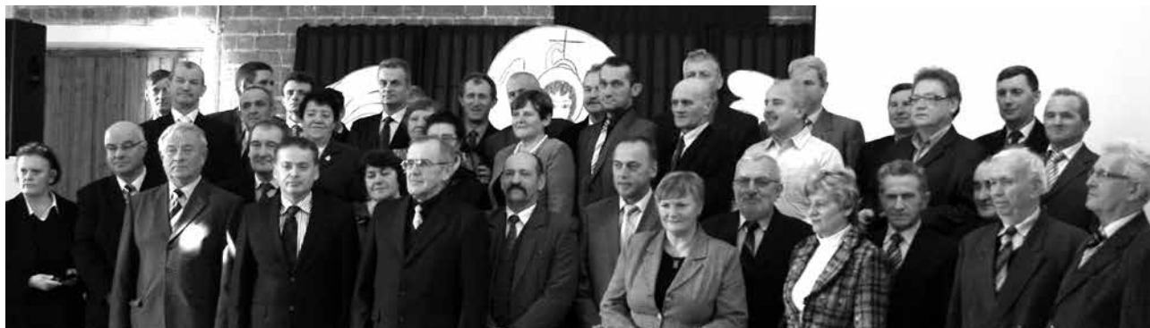
arch. UM Uniejów