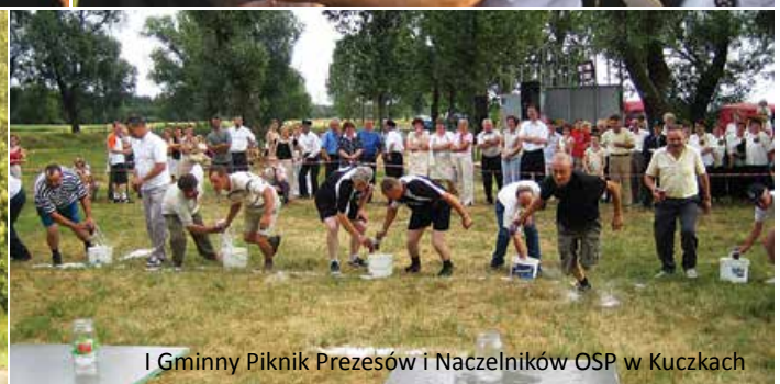
I Gminny Piknik Prezesów i Naczelników OSP w Kuczkach