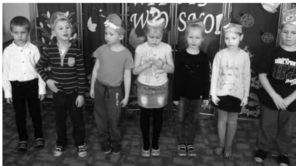
Dzieci 6-letnie w inscenizacji wiersza Jana Brzechwy „Przyjdźcie wiosny”

przyszła do dzieci „w spódniczce mini, sznurowanych butkach i warkoczku”. Tak jak w dziecięcej piosence.