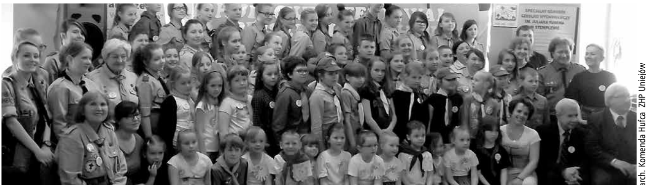
Uczestnicy 23. Festiwalu Piosenki Harcerskiej w Stemplewie