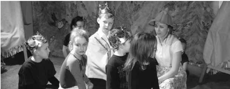
arch. MGOK Uniejów

Wystawione przedstawienie było dla młodych aktorów okazją, aby uczcić Międzynarodowy Dzień Teatru.