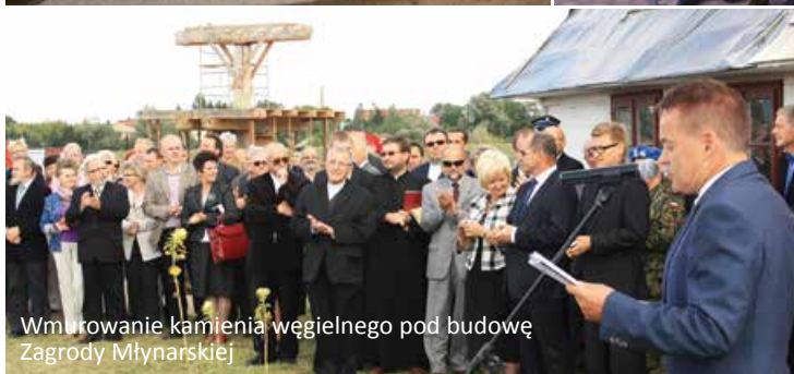
Wmurowanie kamienia węgielnego pod budowę Zagrody Młynarskiej