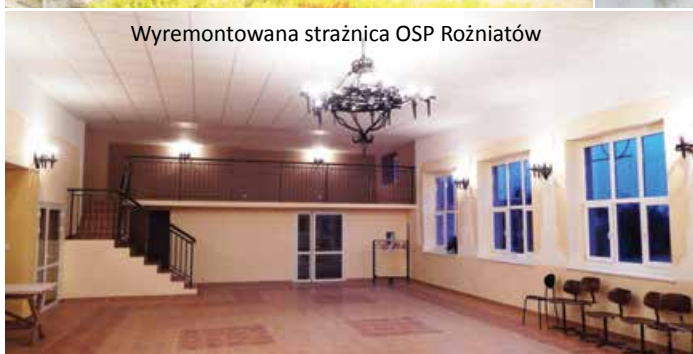
Wyremontowana strażnica OSP Roźniatów