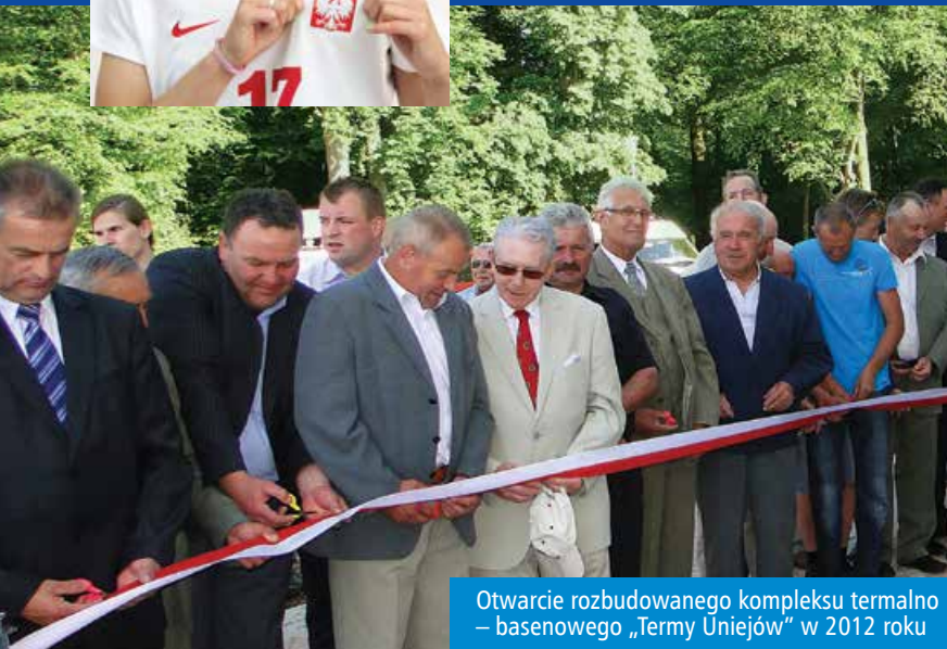
Otwarcie rozbudowanego kompleksu termalno – basenowego „Termy Uniejów” w 2012 roku