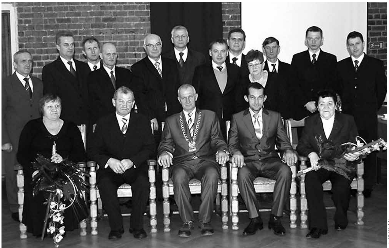
Władze Miasta i Gminy Uniejów VI kadencji