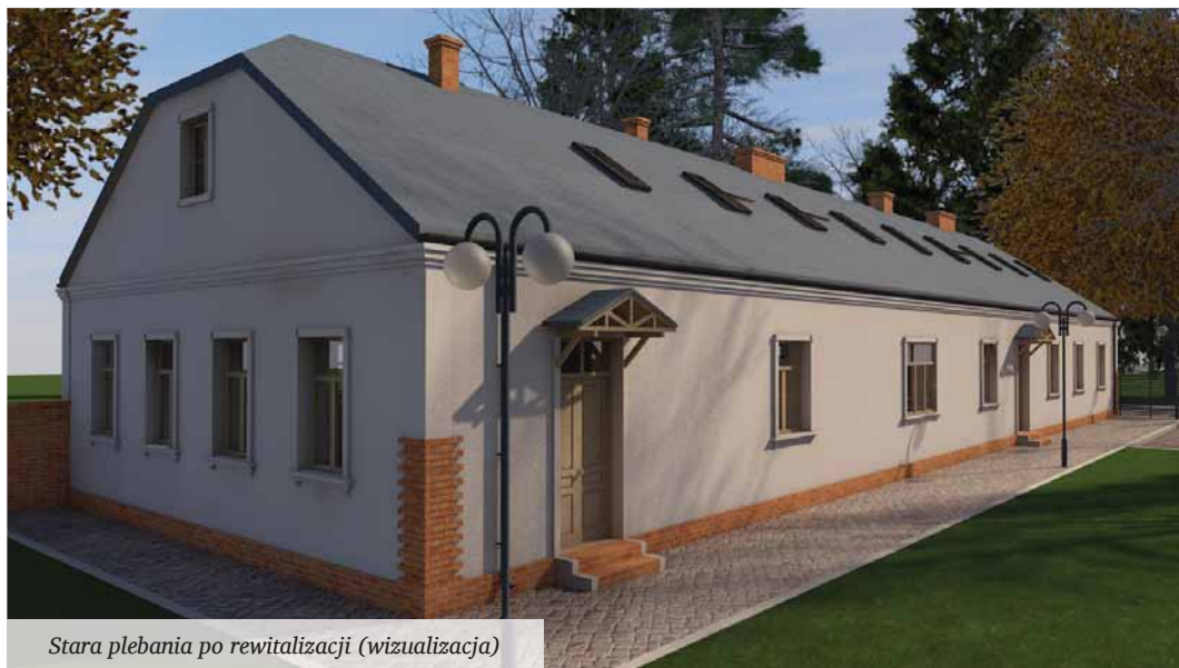
Stara plebania po rewitalizacji (wizualizacja)

Na początku II wojny światowej, w 1939 r., kościół został zniszczony. Zdjęcia zachowane w zbiorach Towarzystwa Przyjaciół Uniejowa dokumentują wstrząsający widok świątyni ze spalonym dachem i zawalonym zachodnim